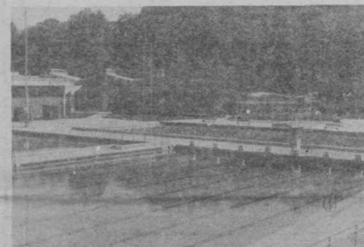
Kopalnica Kodeljevo