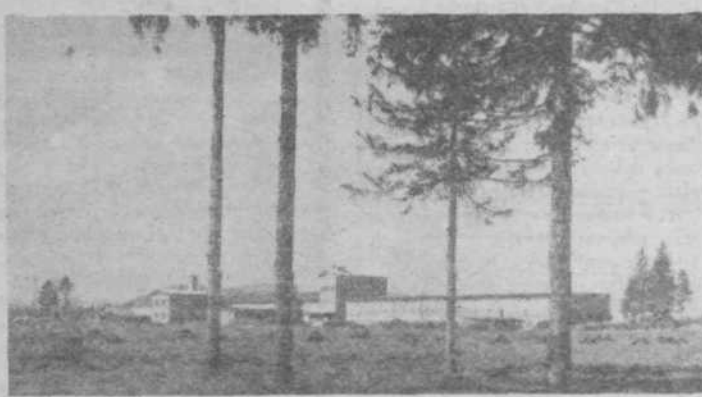
Zalaška farma — tako se je začelo pred 25 leti.