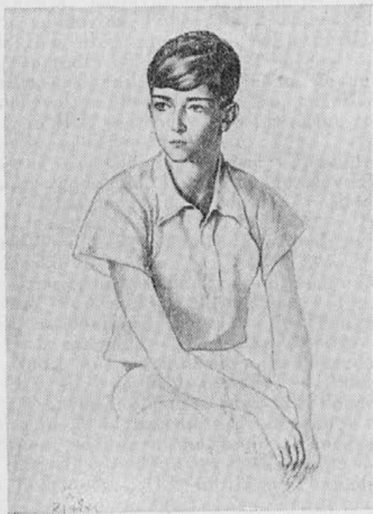
NJ. VEL. KRALJ PETER II.