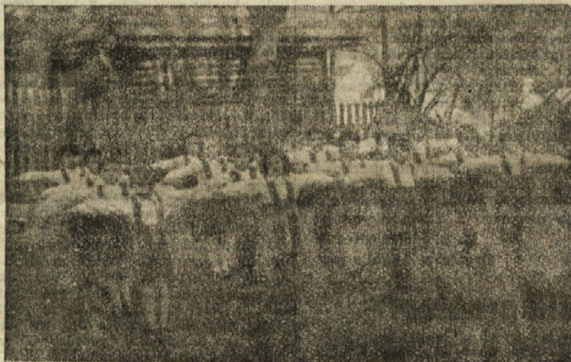
V domu igre in dela v Trbovljah, pri jutranji telovadbi

na dela, ter dve razstavi v DID. Velika pridobitev za okraj so bile prve otroške jasli v Trbovljah, za kar gre zasluga, da so pričele delovati. V glavnem upravi rudnika Trbovlje, ki je pokazalo zato ustanovo polno razumevanje. Te jasli so ene najlepših v Sloveniji ter so pred kratkim dobile priznanje in nagrado od ministrstva za socialno zdravstvo pri vladi LRS.