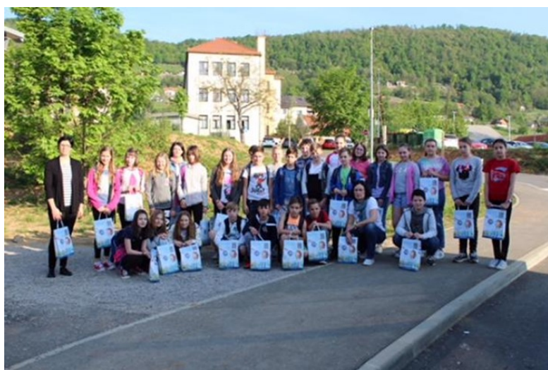
OŠ Belokranjskega odreda Semič, OŠ Dragatuš