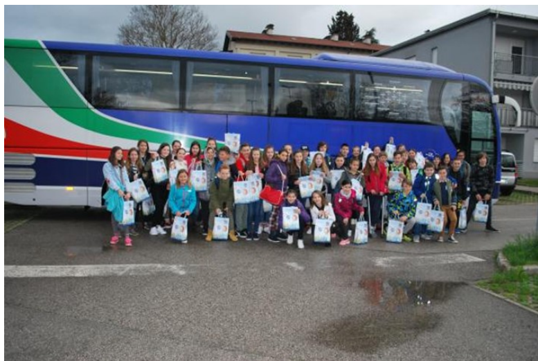
OŠ Frana Erjavca Nova Gorica