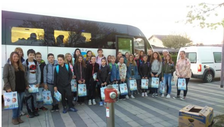
OŠ Puconci