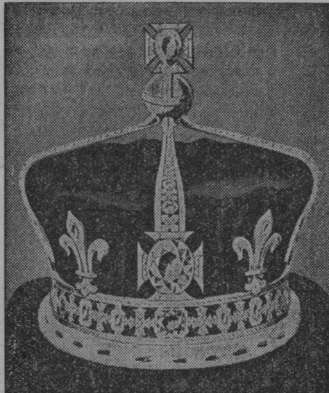
Angleška kraljičina krona je iz platina in jo diči na vrhu znameniti Koh-i-noor dijamant,