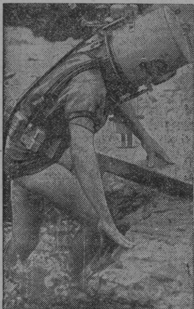
Potapljač v avstralski prestolici v Sidneju si je napravil najbolj priprasto potapljaško opremo, s katero preiskuje dno pristanišča. Naprava je iz čelade in s cevjo za dovod zraka ter iz pasu iz plutovine.

Štiri konje so ukradli eigani v Grčaricah na Kočevskem. Enemu kmetu so ukradli 2 konja,