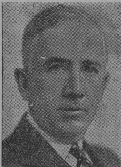
Norman Dawis, ameriški poslanik, se trudi, da bi prišlo do angleško-ameriške trgovske pogodbe. Ta pogodba bi naj krenila svetovno trgovino v urejene razmere.