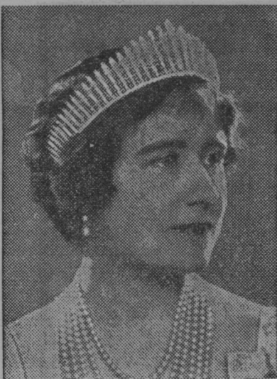
Angleška kraljica Elizabeta.