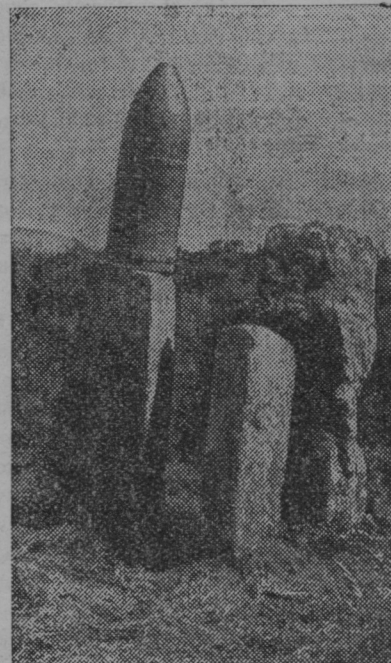
Težka granata, ki ni eksplodirala, služi pri Bilbao na severnem španskem bojišču kot kažipot.

Izreden način samomora. Iz Pariza je prišla 19. t. m. vest, da je izvršil v srednji Franciji cirkuški igralec samomor na izreden način. Znosil si je na kup 40 kg dinamita, se nanj vlegel in ga zažgal. Eksplozija je bila tako strašna, da so popokale šipe na oknih in krajih 6 km naokrog. Zelo hudo je poškodovana farna cerkev v Mitchijelu. Ko so prišli na kraj dejanja, niso seveda našli niti drobca telesa, v zemljo pa je eksplozija izkopala skoraj 10 metrov globoko žrelo.