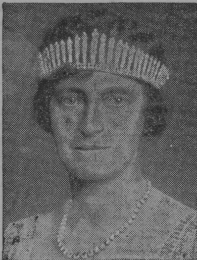
Vladarski jubilej na Danskem. Dne 15. maja bosta slavila danski kralj Kristian X. in kraljica Aleksandrina 25 letnico, odkar sta na prestolu.