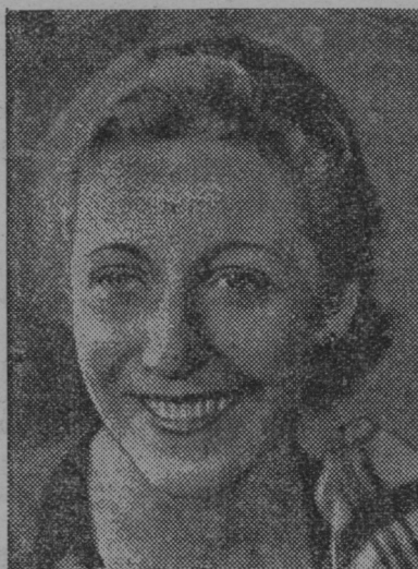
Amy Johnson, znana angleška pilotinja, ki se bo udeležila letos od Francije prirejene letalne tekme ob priliki desetletnice, ko je ameriški polkovnik Lindbergh prvič preletel Atlantski ocean.