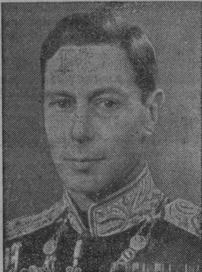
Angleški kralj Jurij VI.

Kraljevi par bo slovesno kronan majnika v vestminstrski opatijski cerkvi v Londonu.