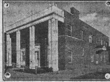
ZAKRAJSEK FUNERAL HOME, Inc.

Frank Novak naš fotograf, je svoje prostore predelal in si napravil lep in pripraven "basement." Tam bi se ga dalo spraviti precej sodov, pa kakor se vi-