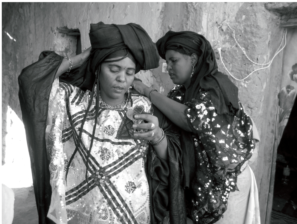
Fotografija 4: Ženska svečana oprava: aftak in afar iz alešo , Ghat 2007 (avtorica: Ines Kohl, vir: Kohl 2009: 108).

medsebojno ogledovanje in prizorišče za izkazovanje prestiža z obleko in nakitom ter za potrjevanje skupne tuareške identitete. Videoposnetke porok si mladi fantje ob večerih še dolgo ogledujejo; glavni namen je prepoznavanje svojih sorodnikov in znancev ter samih sebe in deklet, ki so jim všeč. Mnogi so kritični do razsipavanja, ki ga zahteva primerna pojava na porokah z dragim blagom in zlatim nakitom ter z letečimi bankovci, ki jih kot del plačila ponavadi dobi skupina kitaristov. Za omenjene rituale je značilno izkazovanje prestiža z lepimi oblačili, za kar pa je potrebna vse več denarja. Pri urbani tuareški poroki gre za izkazovanje tuareškosti z združevanjem tradicionalnih in novih elementov, ki so prav tako tuareški (kitare), in ne za izkazovanje modernosti z vključevanjem evropskih elementov, kot je opaziti pri urbanih porokah drugod v Zahodni Afriki (Debevec 2010). V svojih komentarjih so udeleženci kritični do novotarij in tujih elementov, kot so obleke v hausa stilu in »leteči« bankovci. Ker se težko prebijajo iz dneva v dan, se je mnogim sogovornikom zdelo razmetavanje z denarjem ob porokah absurdno. Vendar so v Nigru predvsem neporočeni imažeghan , kadar je bilo le mogoče, vsak zasluženi denar raje investirali v drago blago kot v hrano. Za dostojno počutje v skladu s svojo identiteto je lepa