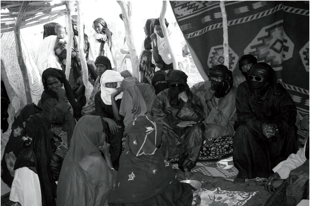
Fotografija 2: Poroka v Nigru 2006.

svoboden človek in je dobil tudi zagrinjalo (Claudot-Hawad 1993: 14, Claudot-Hawad 2001: 151–171). 9 Nicolaisen in Nicolaisen poročata, da za nekatere imghad nošenje taglmust ni bilo bistveno, kot tudi ne za kovače (Nicolaisen in Nicolaisen 1997: 49, 50, 52, 59, 676). Illbakan – ki so imghad – s katerimi sem govorila, poudarjajo enakost z imažeghan in obravnavajo aššak in s tem taglmust kot stvar vedènja. Kovači pa nosijo vse bolj vpadljive taglmust , kadar želijo turistom prodati nakit.