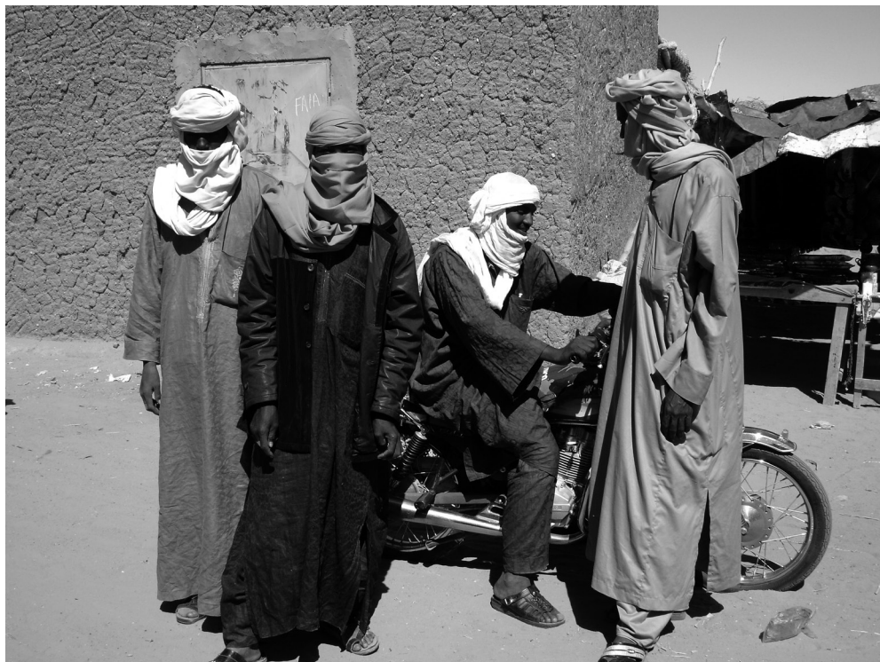
Fotografija 3: Raznobarvni taglmust , ki jih nosijo išumar , Arlit 2006 (avtorica: Ines Kohl, vir: Kohl 2009: 115).

na lastnem hrbtu tovoril hladilnike in televizorje iz Libije v Alžirijo. Najprej so mladi delali, da bi pomagali svojim družinam, ki so v sušah izgubile vse živali. Mačehovski odnos matičnih držav, Nigra in Malija, do stiske ljudi je privedel do tega, da so išumar zavrnilo pasivno politiko tradicionalnih elit kot tudi pragmatično politiko novih elit iz časa kolonializma in po neodvisnosti. Zavračanje vrednot tradicionalnih elit, ki svojih ljudi niso znale rešiti iz težke situacije, so išumar kazali tudi tako, da so odložili taglmust . Toda po tej prvi fazi zavračanja so se ponovno obrnili po navdih k tradiciji in v taborih na kasete snemali tradicionalne pesmi (Hawad 1990). Nekateri med njimi so začeli ustvarjati tuareški saharški bluz, v katerem je tradicionalni nzad zamenjala najprej akustična in nato električna kitara. Pesmi opevajo puščavo Tenere kot tuareško ozemlje, govorijo o težavah življenja išumar , problemu identitete in boju tuareškega ljudstva za svobodo ter tako kot velik del tradicionalne poezije tudi o ljubezni (Kohl 2009: 101–107; Beliamat 2003). Ženske, ki so ostale v taborih, so bile kritične do išumar , češ da so pobegnili od dolžnosti skrbi za družino (Hawad 1990: 129, 130; Spittler 1993: 219). Šele med uporom v Nigru je večina Tuaregov boj podpirala že v začetku. V Maliju je bil prvi upor že v 60.,