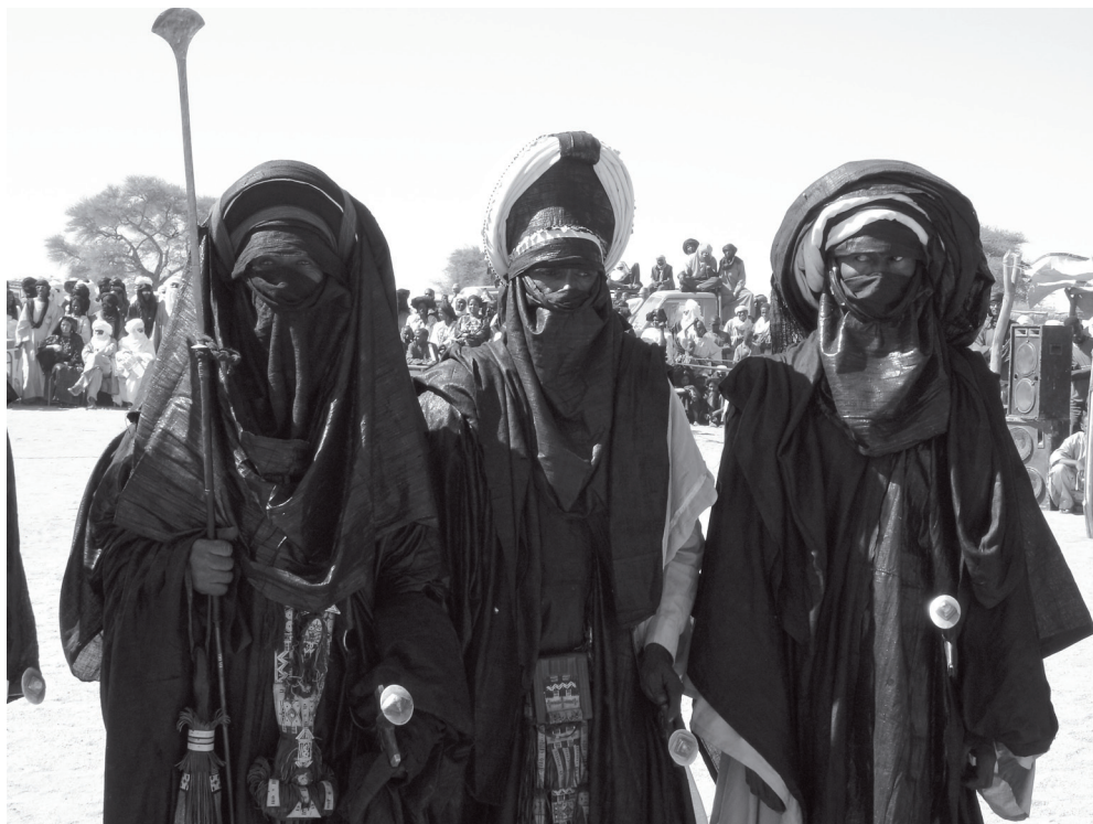
Fotografija 5: Svečana moška oprava nastopajočih na festivalu Aira, Iferouane 2006 (avtorica: Ines Kohl, vir: Kohl 2009: 124).

da se med Tuarege vključijo tudi s pomočjo obleke, vendar na kratkem potovanju tega ne morejo storiti tako, da bi razumeli ali celo privzeli vrednote, povezane s taglmust , in zato ta kos obleke na nepoučen način nosijo po svoje. Obleke se turistom predstavi tudi kot udobne za potovanje, kar dejansko so. V glavnem si tudi turistke ovijejo ešeš , da jih v puščavi varuje pred vetrom in soncem. Deloma gre za praktičnost oblačilnega dodatka, deloma pa tudi za bolj ali manj igrivo preoblačenje v eksotično počitniško okolje.