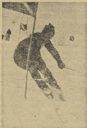
Milanu Nadišarju ze spet zasneljivo »laufalo«

Prav z veseljem zapišem še stavek o udeležbi smučarjev iz Elektromehanike in Solskega centra Iskra. Blizu sto smučark in smučarjev je štel njihovo zastopstvo. In njihovi napor niso bili zaman, ob dobrih posamičnih uvrstitvah, so si smučarji Elektromehanike zagotovili v ekipni razvrstitvi kar prvo in drugo mesto in s tem znova potrdili, da na smučarskem področju zares veliko veljajo. Sicer pa naj o njihovih dosežkih na letošnjem veleslalomu spregovorijo doseženi rezultati.