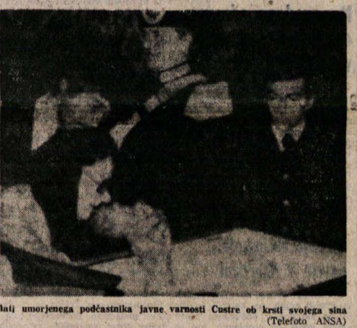
Mati umorjenega podčastnika javne varnosti Cestre ob krsti svojega sina