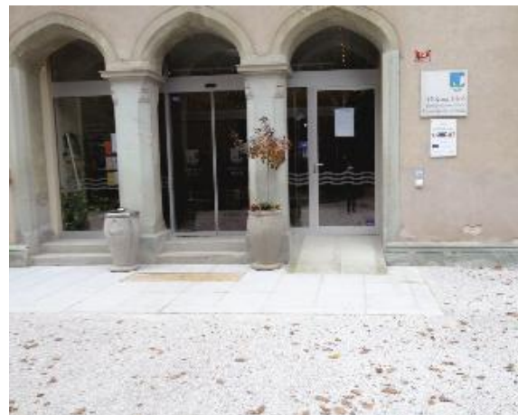
Novo urejeno dvorišče občinske stavbe, vile Zora – po na novo urejeni hidroizolaciji in ogrevalnem sistemu.