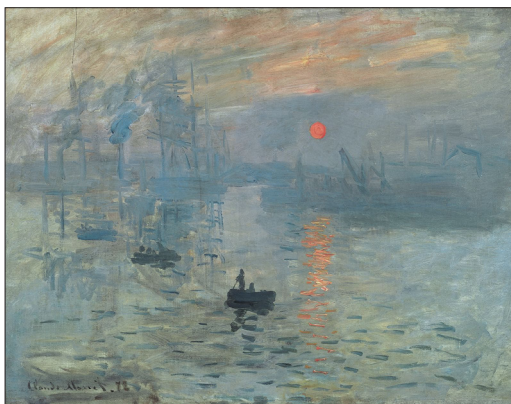
Claude Monet: Impresija: vzhajajoče sonce , 1872. V barvni različici.

in nevroznanostjo možganskih funkcij in umetnosti, je področje barv in svetlobe. Barve izhajajo iz aktiviranja treh vrst mrežničnih čepkov (modrih, rdečih in zelenih) in pozneje aktiviranja celic vzdolž »kje« pot. Pri svetlobnem zaznavanju se prepletajo in dodajajo aktivnosti čepkov ter zbujejo subjektiven občutek osvetljenosti določenega območja. Po navadi barvni kontrast povzroči tudi svetlobni kontrast, ne pa vedno. V znani sliki Clauda Moneta Impresija: vzhajajoče sonce / Impression: Soleil levant , 1 kjer oranžno sonce kar trepeta od svetlobe, je svetlobna vrednost naslikanega sonca enaka osvetljenosti okolja, zato, če gledamo sliko v črno-beli tehniki, ki barvno vrednost eliminira, sonce preprosto »izgine«.