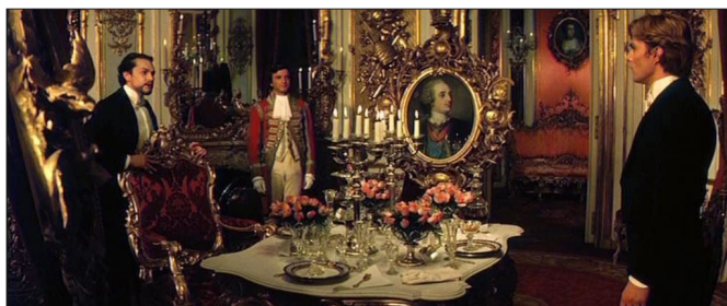
Luchino Visconti: prizor iz filma L'innocente , 1976

mozaiki prvo- in tretjeosebničnih prostorov in uporabljal t. i. tehniko cross fading , s spreminjanjem ozadja tako, da se je le-to razgrajevalo iz ene scene v drugo; tako je dosegal prepričljiv in realističen učinek časovnega, prostorskega in pripovednega toka. Kmalu po kapi je nadaljeval snemanje, a njegov slog se je – tako v nadaljevanju Ludwiga kot v zadnjih dveh filmih ( Gruppo di famiglia in un interno iz 1974 in L'innocente iz 1976) očitno spre-