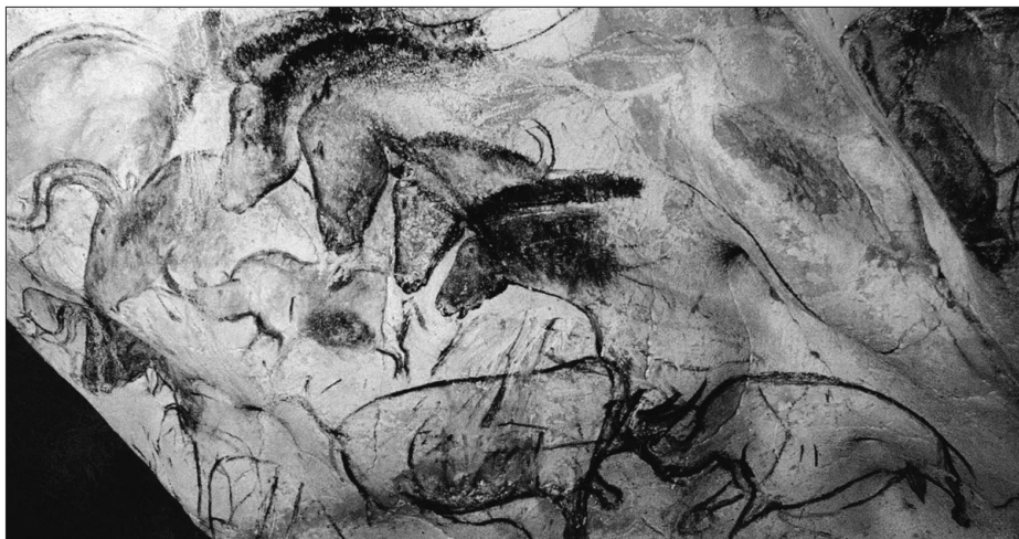
Konji in boj nosorogov (jamska poslikava iz jame Chauvet, 30.000–32.000 pr. n. št.)

Odgovora na uvodno vprašanje (seveda) ne poznamo, o tem lahko bolj ali manj kvalificirano ugibamo. Ali je tudi umetnost oblika evolucijske prilagoditve, npr. kognitivnega mehanizma, ki utrjuje socialno kohezijo (Boyd, 2005), spolno privlačnost, je umetniško ustvarjanje način, da pokažemo in dokažemo svojo nadarjenost, spretnost, uspešne gene (Miller, 2001), ali pa je umetnost zgolj prijeten stranski produkt evolucije ( cheesecake of the mind ), kot trdi Pinker (2009)? Lahko je seveda vse to. Najsi bo prvo ali drugo ali tretje, kombinacija naštetega, dejstvo je, da ima umetnost globok vpliv na življenje naše vrste, posameznikovo in družbeno. Prav zato si pogosto zastavljamo vprašanja tudi o odnosu med umetnostjo in mislijo, umetnostjo in dušo, umetnostjo in čustvi, umetnostjo in možgani. Ali lahko razumemo biološko dimenzijo edinstvene in čudovite zmožnosti ljudi, da ustvarjajo in uživajo umetnost?