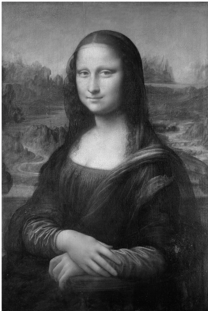
Leonardo da Vinci: Mona Lisa , 1503–1504

Na zgodnjih stopnjah vidnega procesiranja oko in možgani razgradijo vidno