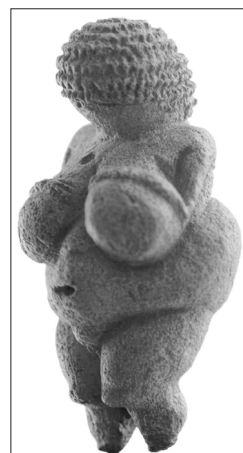
Slika 10: Willendorfska Venera , 28.000–25.000 pr. n. št.