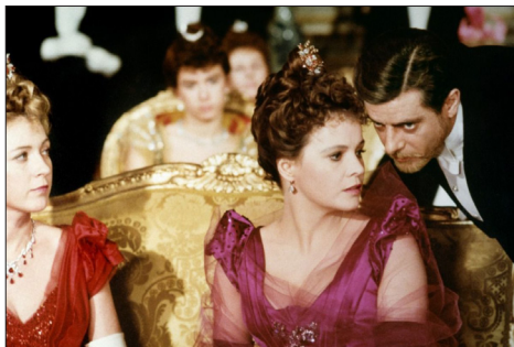
Luchino Visconti: prizor iz filma Ludwig , 1972

Lovis Corinth je bil znan po svojih izrazito telesnih zgodovinskih kompozicijah in portretih. Po možganski kapi v predelu desne hemisfere sta telesnost njegovih figur in njihova umeščenost v prostor postali manj izraziti, osiromašeni, še zlasti na levi strani ( Portret Charlotte Berend – umetnikove žene – in Avtoportet ). Tudi Luchino Visconti je pri 66 letih med snemanjem filma Ludwig utrpel kap v desni polobli. Filmi, ki jih je ustvaril pred boleznijo ( Senso , Il Gattopardo , La caduta degli dei , Ludwig ), so bili pregovorno skoraj teatersko scenski, s skrbnim dekorjem obvladovanih velikih panoramskih prostorov, kamor je predmete in igralce umeščal v presečišče treh kamer, se poigraval z