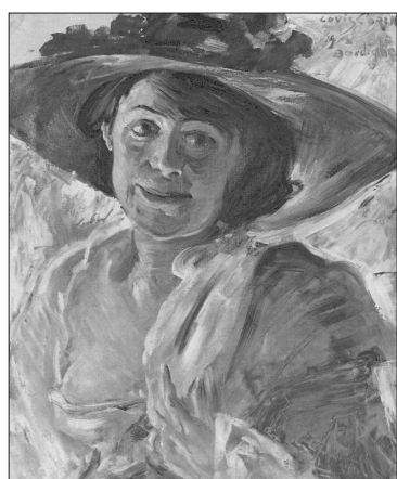
Lovis Corinth: Portret umetnikove žene Charlotte Berend-Corinth , 1912

Vzrok je difuzna reprezentacija nevroloških zidakov estetske izkušnje. Nekateri umetniki bodo po možganski poškodbi razvili nove tehnike kot kompenzacija za senzorične, perceptivne in kognitivne omejitve. Motnje na različnih stopnjah vidnega procesiranja bodo sicer dale značilne klinične slike, ki pa se bistveno ne razlikujejo med umetniki in laiki.