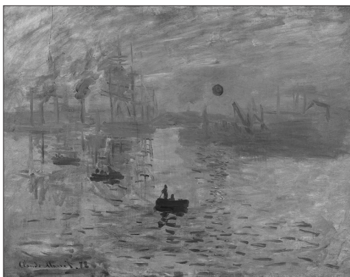
Claude Monet: Impresija: vzhajajoče sonce , 1872. V črno-beli različici.

Zanimivo je tudi, da upodobitev senc zahodna umetnost pozna od antike, vzhodna pa jih upodablja šele od nedavnega (Gombrich, 1995). Kako zlahka nas prepričajo tudi z zakoni fizike popolnoma nezdružljivi koti in velikosti senc ( Rojstvo device/ Nascita della Vergine renesančnega umetnika Fra Carnevala), kadar so le za odtenek temnejši in če niso preveč telesni (Luca Signorelli).