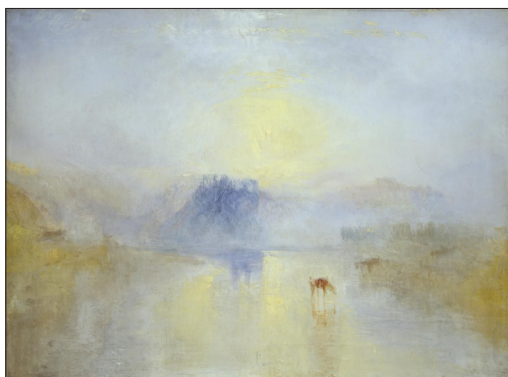
Joseph Mallord William Turner: Grad Norham (sončni vzhod) , 1845