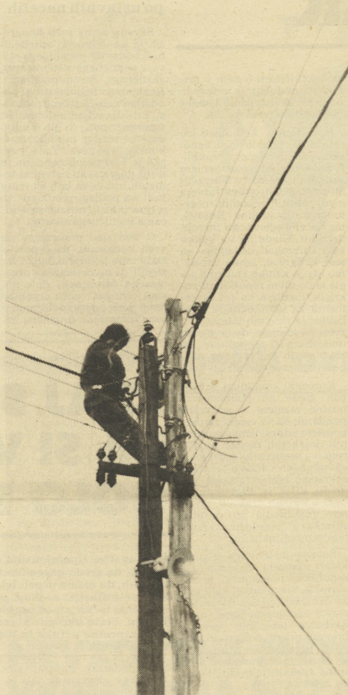
Slaba telefonska zveza

stavi, ki imajo po svoji politični moči zelo tehten vpliv. Toda opozoril je, da je moč zaznati strmo padanje sodelovanja ljudi pri presoji nekaterih kandidatov za vodilne funkcije na republiški in zvezni ravni. Delež tistih ljudi, ki izjavljajo, da nimajo vpliva pri določanju kandidatov za vodilne funkcije na ravni republike in federacije, da niso v igri, je visok in se giblje okoli treh četrtin anketiranih. Ta podatke jasno kaže na veljavo delavcev in občanov pri določitvi o tem, kdo bo stal na vrhnjih stopnicah naše družbene organiziranosti, kajti bolj ko gremo proti vrhu, bolj plahni ta vpliv. Kot opozorilo velja vzeti Markičevo razmišljanje, da če kandidate za najpomembnejše družbene funkcije izberejo pretežno v kadrovske telesih, potem pomeni za temeljno družbeno raven to imenovanje, ne pa svoj vpliv in odločanje. Seveda ob sorazmerno mahnem vplivu ljudi na kandidiranje čelnih delegatskih dolžnosti brzokone drži, da lahko, če so rešitve skuhane v ozkem krogu, pridejo kaj hitro v skušnjavo, čutijo se odgovorne središčem političnega odločanja, to je tistim, ki so jih uspešno spravili skozi vse postopke.