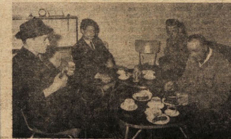
Za vse krvodajalce je bilo pripravljeno okrepčilo

Ob letošnjem 10. praznovanju Dneva krvodajalcev je glavni odbor Rdečega križa Slovenije podelil odlikovanja 53 cinkarinarjem, ki so dosegli peto, desetno in dvajseto oddajo krvi.