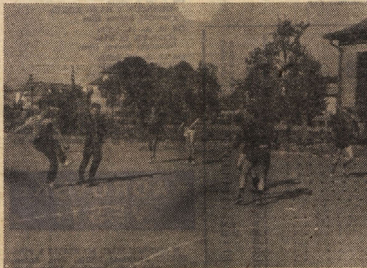
Na letošnjem tekmovanju v počastitev Dneva mladosti so bili naši mladinci zelo uspešni. Na sliki: srečanje nogometašev

Dne 5. maja pa je bila na sporedu tekma Cinkarna : Zlatarna. To srečanje je Cinkarna dobila z rezultatom 3:0, brez borbe. Ekipa Zlatarne ni bilo. Srečanje EMO: Merx pa je bi-