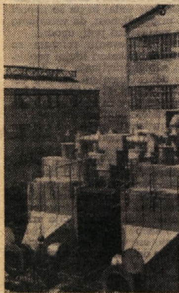
Pogled na del novega obrata za proizvodnjo žveplene kisline

Raziskovalci v našem podjetju so se ukvarjali tudi s problemom, kako pripraviti takšno vrsto cuprablaue, ki bi imel manj bakra, a isti učinek. To bi seveda povečalo rentabilnost obrata. Problemu sta se posvetila inž. Jedločnik in inž. Farčnikova. Nastal je nov produkt — »cuprablau Z«. Z dodatkom določenega odstotka cinkovih soli sta dobila preparat, ki je približno 100% bolj aktiven kakor cuprablau. Istočasno pa se je vsebina bakra zmanjšala za določen odstotek.