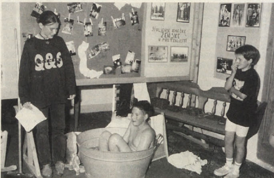
Mladi so predstavili vzdrževanje higijene. Čeprav v starih časih kopalnic še ni bilo, otroci tudi na Zilji niso bili umazani