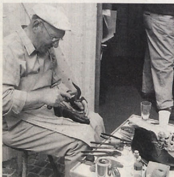
Ob predstavitvi rezultatov etnološke delavnice je nastopil tudi čisto pravi »šuštar«

Sposrečeno razstavo se je v petek, 4. julija 1997, končala peta etnološka delavnica, ki so jo organizirali krajevno prosvetno društvo »Zila«, Slovenska prosvetna zveza in pobudnik Zveza prijateljev mladine iz Ljubljane. Ducat otrok z