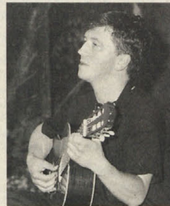
Posebno doživetje pri Cingelcu je bil nastop proslavljenega pesmarja Iztoka Mlakarja

SPD »Borovlje« pa že vabi na naslednjo prireditev pri Cingelcu na Trati: v nedeljo,