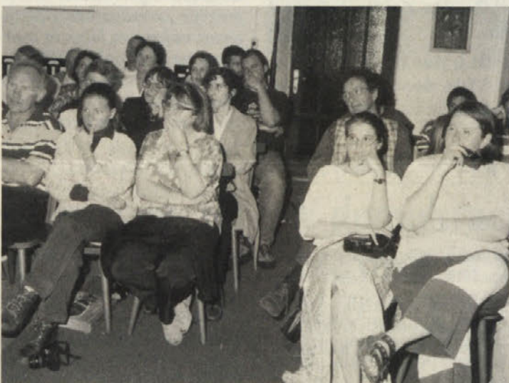
Domačini in gostje so z velikim zanimanjem prisluhnili izsledkom mladih raziskovalcev