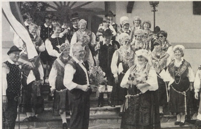
Prijatelji iz Tacna so na tokrat vetrovne Radiše prinesli pesem in dobro voljo