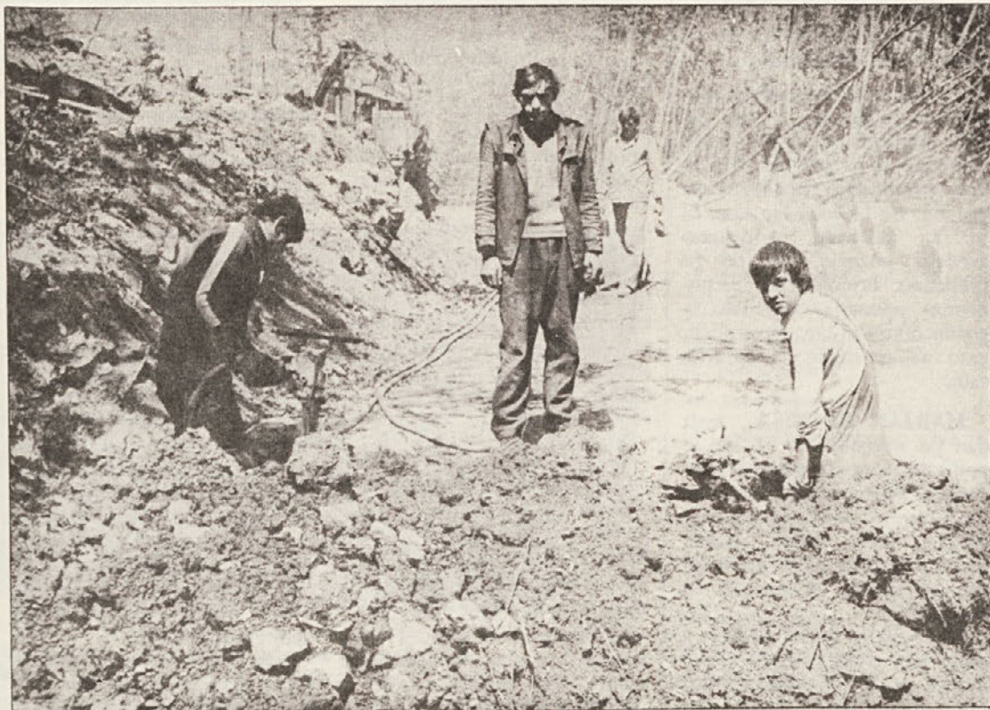
Vrtanje lukenj za miniranje je zaradi tresenja in močnega hrupa eno težjih del. Na sliki skupina delavcev pri pripravi prečnega jarka za odvajanje vode.

Iz razgovora v TOZD je očitno, da prevoz lesa opravljajo v redu, saj je učinek voznikov, v primerjavi s planiranim, celo presežen za 19 odstotkov. To pa ne pomeni, da ne bodo zmogljivosti razpoložljivega prevoznega parka v posameznih obdobjih še vedno manjše kot pa zahteve. Z razporejanjem kamionov na najnujnejša dela in odložitvijo manj nujnega pa bo končno le vse delo opravljeno ob pravem času. Te težave ne bo težko premostiti, če bo dovolj razumevanja med TOZD za gozdarstvo in novo TOZD za transport in gradnje.