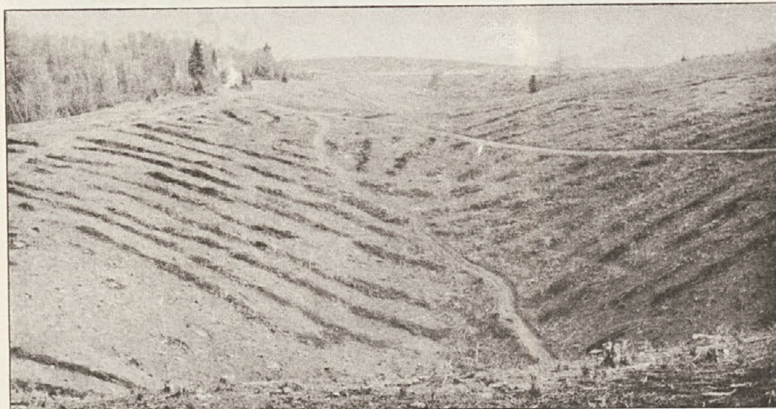
Značilna podoba po pripravi tal na področjih, kjer je nekdanje pašnike že močno prerastlo gmovje in posamično drevje. Taka priprava je zelo zamudna, saj je potrebnih celo do 50 dni za hektar.