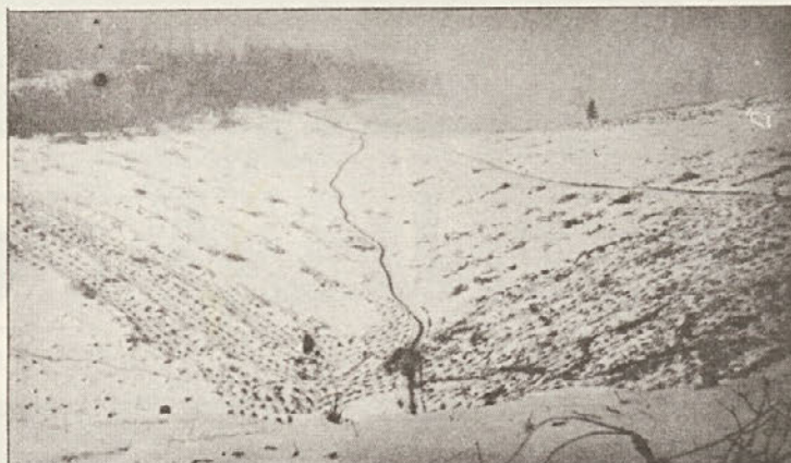
Jeseni 1980 nas je pri pogozdovanju v Podgrajski gmajni prehitel sneg!

Domačim kupcem smo prodali 13.272 m 3 hlobovine in