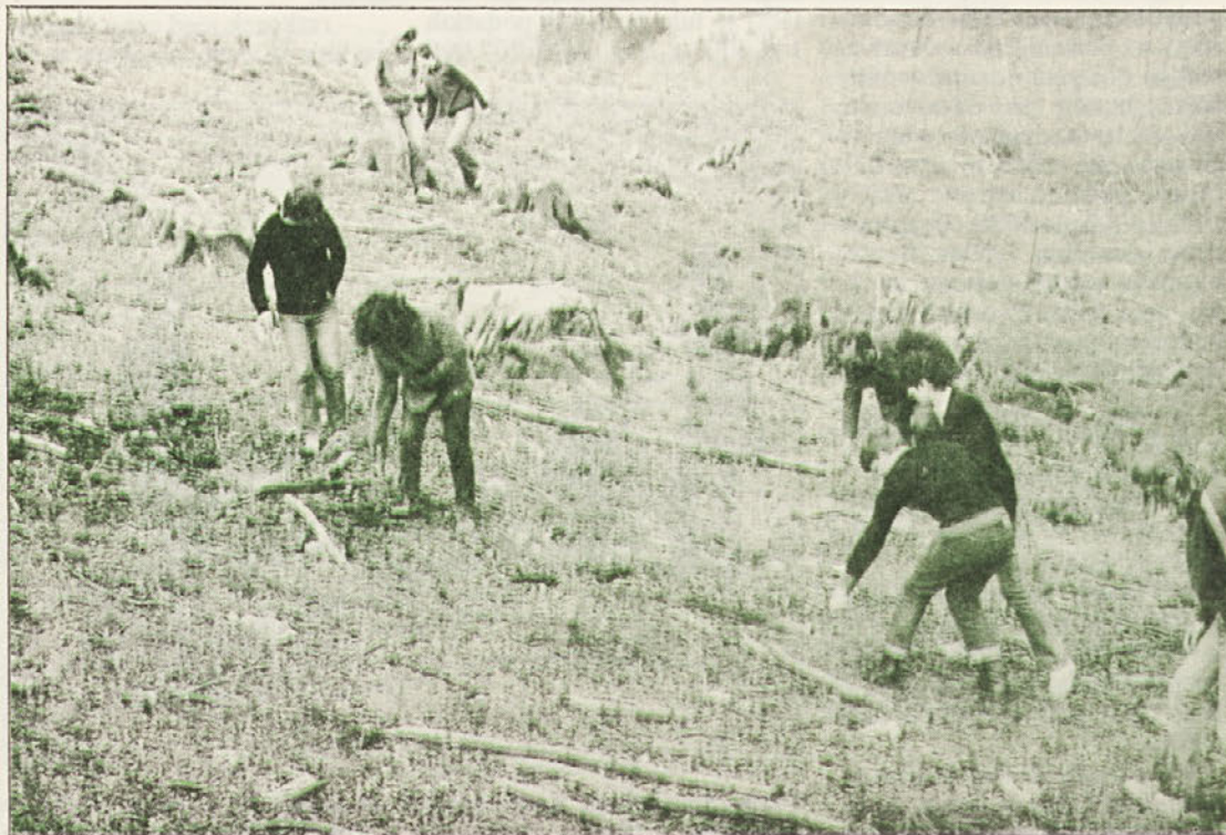
Dve skupini dijakov sta popravljali in utrjevali sadike, ki so bile posajene jeseni, pa jih je polegel visok sneg. Za končni šolski izlet so si tako dijaki prislužili dobrih 7.000 din (foto ing. J. Penca).