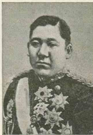
Maršal Ojama, vrhovni poveljnik vse japonske armade.

Zjutraj dne 23. junija so ruske križarice z oklopniciami šle iz portarturskega pristanišča. Admiral Togo jih je napadel. Boj je trajal od 3. ure popoldne do 4. ure prihodnjega popoldne. Ker je hotel Togo odrezati rusko brodovje od pristanišča je ruski poveljnik admiral Withöft ukazal, da se je vrnilo v pristanišče. Japonci so nato s suhega in od morja ponavljali svoje napade, ki so jih pa Rusi vedno