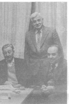
232 sedežev je v dvorani doma krajanov v Vnanjih Goricah. Na otvoritvi je bilo okrog 360 obiskovalcev. Tak odziv daje spodbudo in pogum. Zato že sedaj vabijo kulturni delavci krajane in okoličane na včlanje v najrazličnejše kulturne skupine. Če zainteresirani se ne vedo točno, v kateri sekciji bi radi sodelovali, naj si v naslednjih tednih vsaj ogledajo prireditve v dvorani.