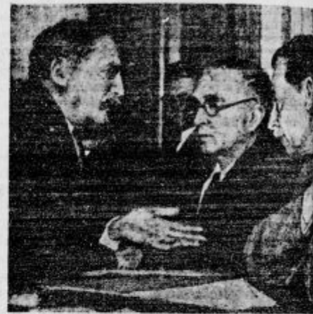
Leon Blum, bodoči predsednik francoske vlade, v razgovoru s somišljeniki.