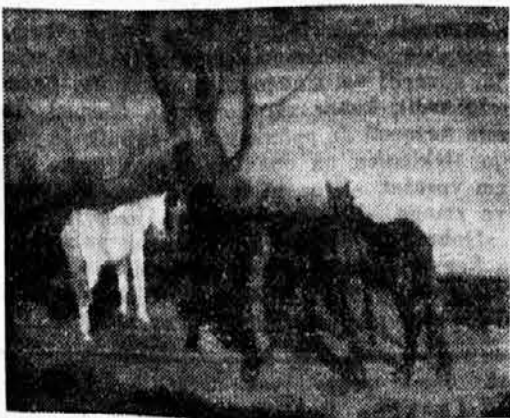
Vidmar Nande: Konj.