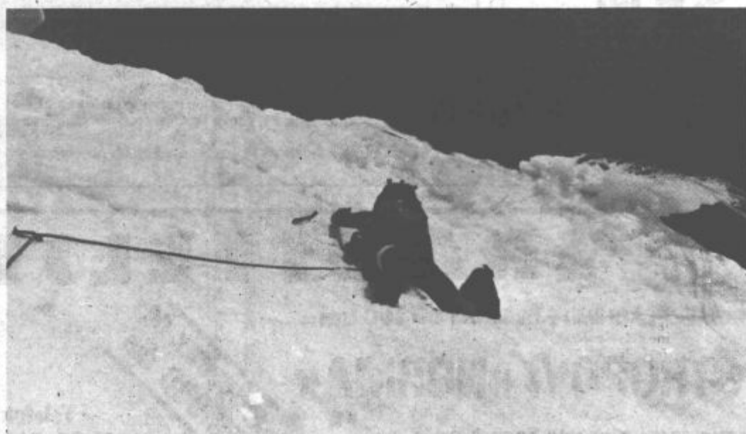
Ponekod je strmina taka, da se bojim ozreti v globino pod seboj

Pa zmoremo tudi to in ko že v globoki temi v dolini najdemo še zadnji prehod čez deročo Arčo, si oddahnemo. Skozi redek gozdiček nas že vabijo lučke alplagerja Ala-Arča in čeprav ni nič posebnega, smo ga v teh trenutkih otročje veseli. Še posebno zato, ker je sedaj za nami res mogočen vzpon, zaradi katerega smo pravzaprav prišli v Tien-Šan.