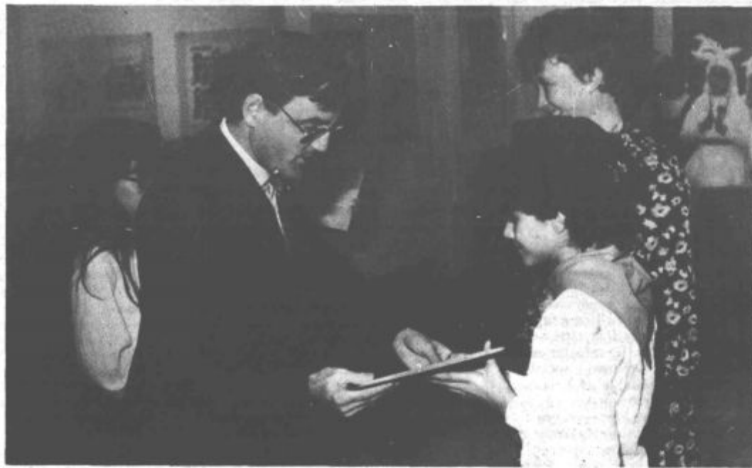
Ob praznovanju letošnjega dneva republike so pionirji te šole prejeli za marljivo delo priznanje izvršnega sveta