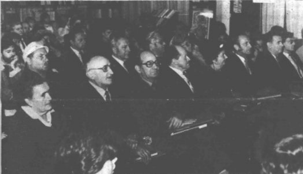
S proslave v počastitev dneva republike