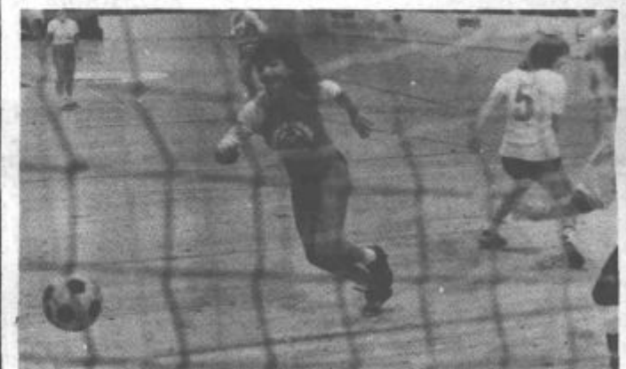
Tudi dekleta znajo »brcati«