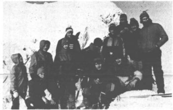
Na vrhu Male Rinke