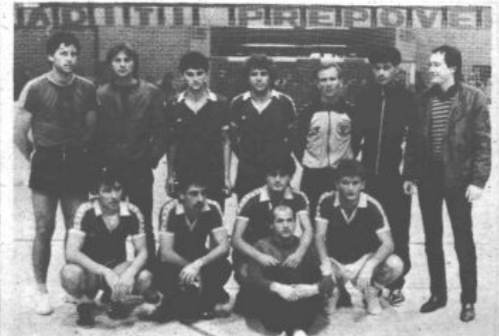
Ekipa Rdeče vrtnice

Pri dekletih pa je bila najboljša strelka Britovškova (Škale). Petkrat je premagala nasprotno vratarko.