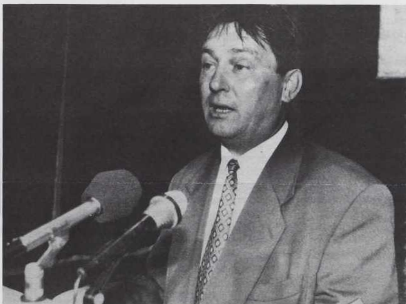
Ob 20. avgustu smo praznovali tako v Monoštru kot na Gornjem Seniku