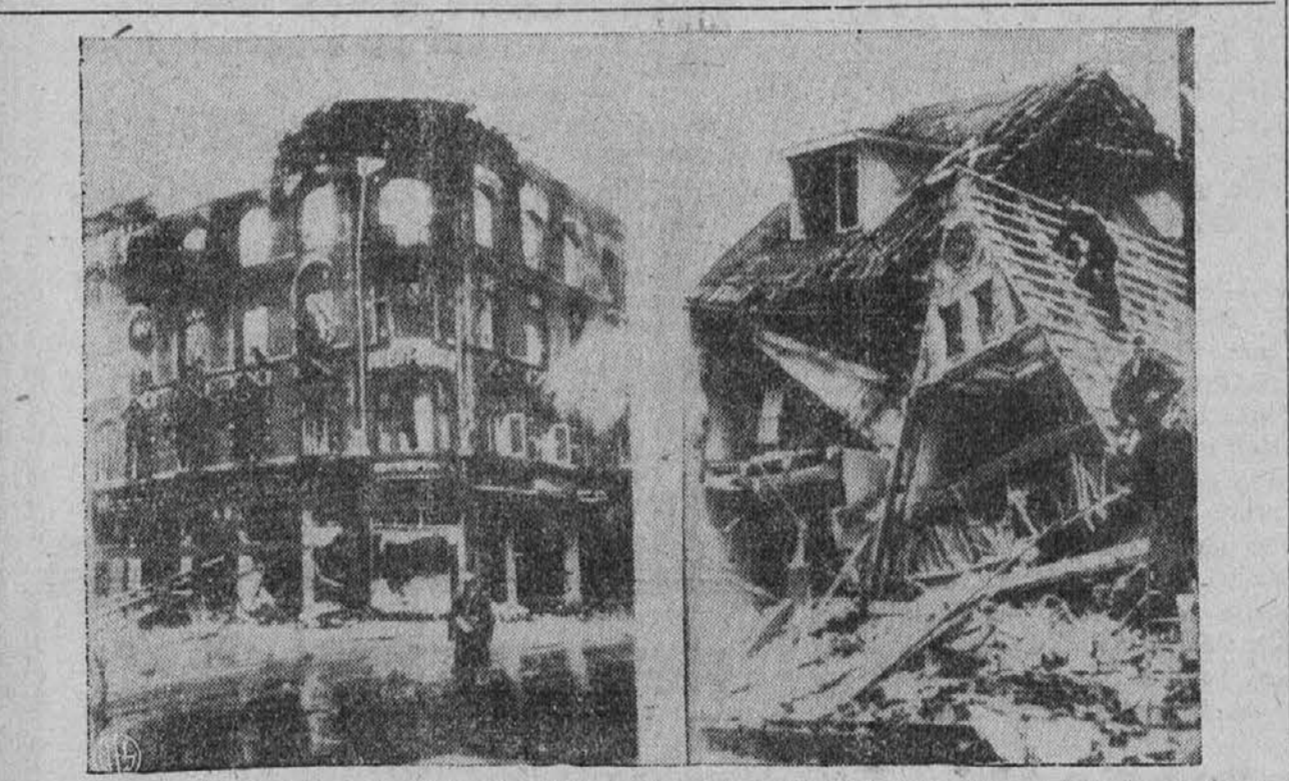
Gornja slika je poslana iz Stockholma in nam predstavlja porušeno poslopje Aarhusa v Aarhusu, Danemarsko. V tej razstrelbi, ki jo imenujejo Danci protisabotažo Nemcev, je bilo ubitih tudi nad sto gestapovcev. Nemci so poglani v zrak celo cesto v tem mestu.