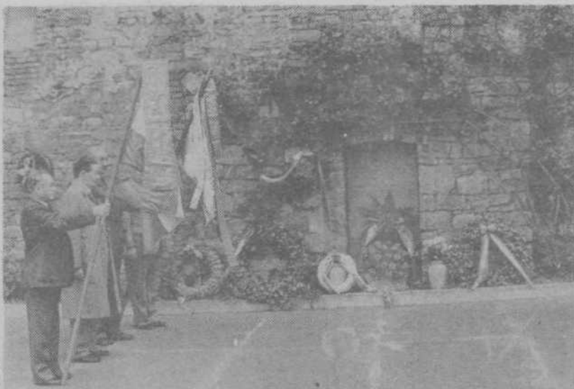
Prapori so se poklonili v spomin žrtvam prav na kraju, kjer je stal krematorij, v katerem je zgorelo več tisoč antifašistov.

Bivši interniranci so obiskali tržaško Rižarno – tovarno smrti