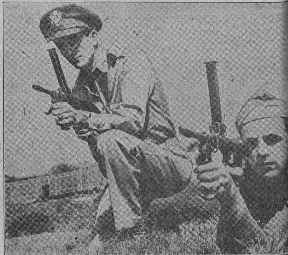
Na sliki sta dva avstralska vojaka z nove vrste brzostrelnimi puškami, s katerimi je mogoče izstreliti deset strelcov na sekundo.