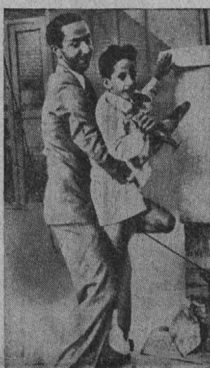
Na sliki je sedem let stari kralj Feisal iz Iraka, kateremu pomaga neki dvorjan na tla s strehe, s katere je mladi kraljič užival razgled po okolici.

"Gospod... gospod župnik?" je vrtil klobuk med prsti.