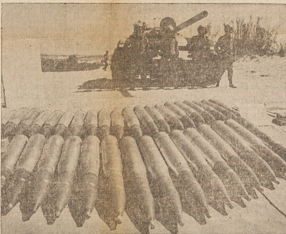
SOVRAZNIK JIH JE OPREMIL — Izraelci so v vojni z Egiptom junija 1967 zasegli veliko število egiptskih tankov sovjetskega izdelka. Te tanke so postopno popravili in jih vključili v svoje oborožene sile. Na sliki vidimo enega od teh tankov s posadko pred njim in v ospredju z zalogo granat za njegov top.