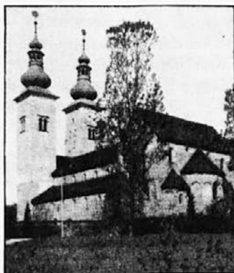
Stolnica v Krki

Ko je Ema ostala vdova brez otrok, ji je dajala vso duhovno moč njena globoka in preskušena vera. Zemeljskim upom se je junaško odrekla in začela velikodušno delo za božje kraljestvo. V njenih rokah se je leta 1036 združila velikanska posest v teh deželah. Ema jo je kos za kosom premišljeno obrnila v korist ljudstva in Cerkve, tako da je nazadnje sama ostala prostovoljno ubožna in je odšla brez posvetnih bremen v samostan čakati smrti. Po smrti sina Viljema se začelja z njeno odpovedjo svetu njen strmi vzpon v svetništvo.