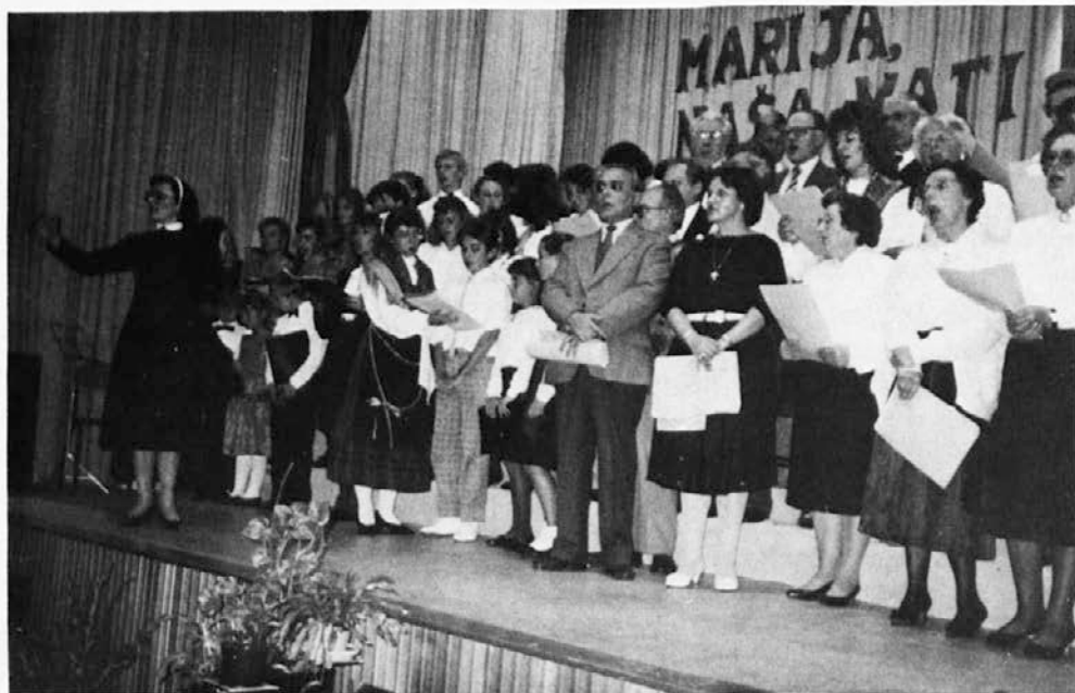
To je le del pevcev na odru dvorane sydneyjskega verskega središča ob majski MARIJANSKI AKADEMIJI