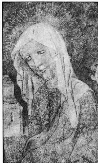
SVETA EMA (ali HEMA), kakor jo upodablja stara cerkvena freska. Rojena je bila leta 983, verjetno na gradu Pilštajn na Sp. Štajerskem, umrla 1045 v Krki. Njen god slavimo 27. junija.

Prav v tistem času, ko je sveta Ema odraščala, se je v naših krajih obnavljalo krščanstvo, ki so ga nedavno prej zatrli divji poganski Madžari. Leta 955 so bili ob reki Lech dokončno premagani in prisiljeni, da se držijo v svojih mejah, se stalno naselijo in sprejmejo krščanstvo. V naslednjih desetletjih se je vračala na slovensko zemljo oblast rimsko-nemških cesarjev in