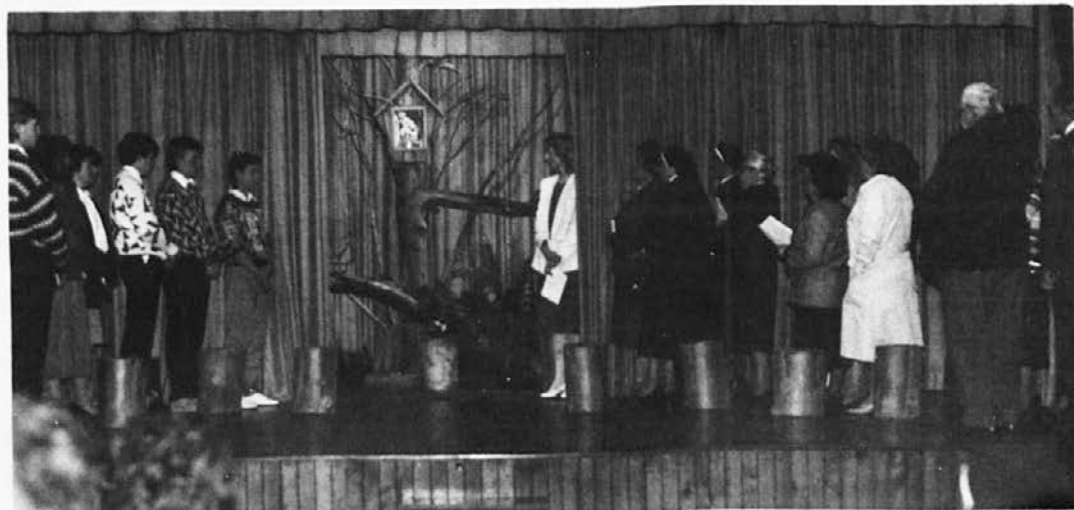
Domače Marijino znamenje je bilo središče odra naše Marijanske akademije