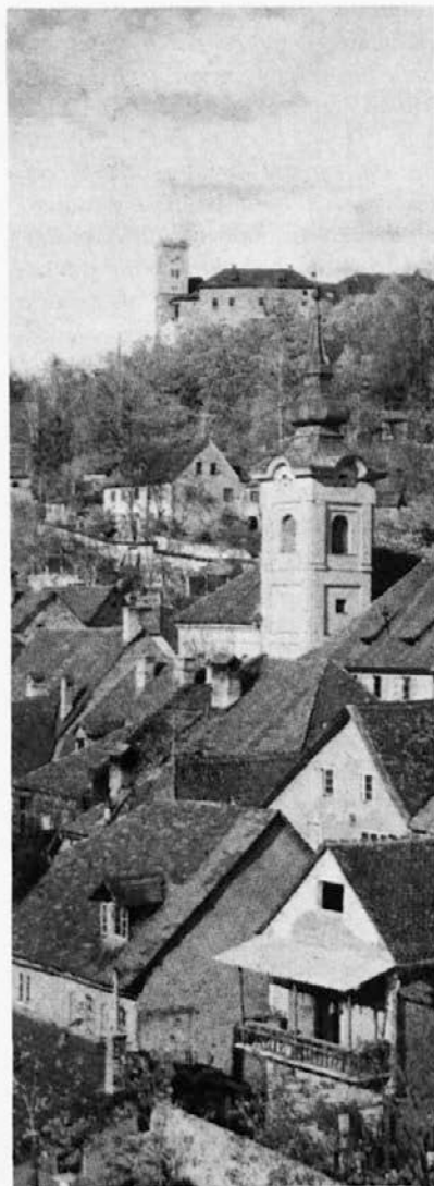
Del stare Ljubljane z Gradom

Organizatorji canberrskega molitvenega zborovanja kristjanov so bili federalni pravni minister sena-