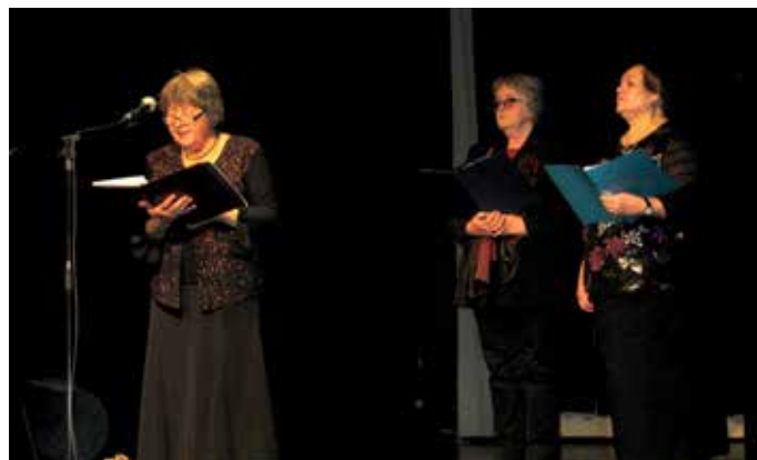
Recitatorke trzinskega društva upokojencev so oder napolnile z zanosom in ponosom.