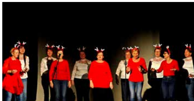
Trzinke so tokrat navduševale v decembrskih modnih kreacijah.