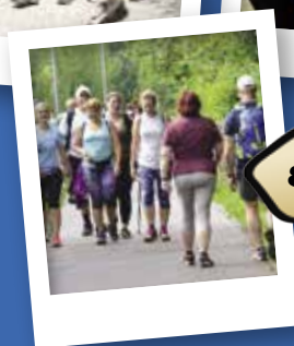
4. POHOD OB REKI, KI POVEZUJE