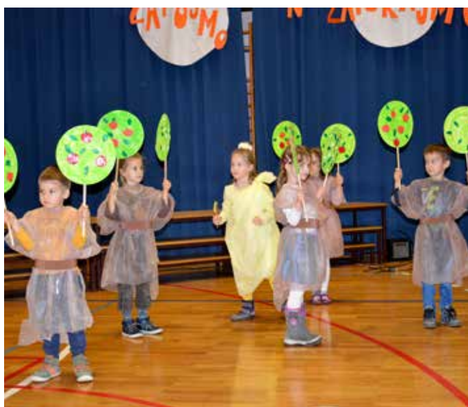
Iz vrtca Palčica so pribrenčali Čmrliji in s pomočjo Vivaldijevih Štirih letnih časov prikazali letne čase.