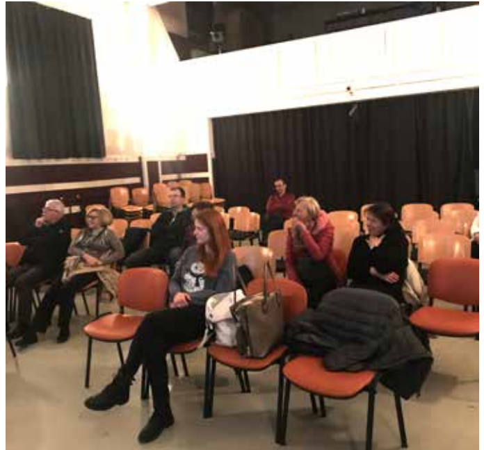
Obiskovalcev potopisa o Japonski je bilo zaradi obilice decembrskih prireditev manj kot po navadi, a s(m)o zato ti toliko bolj uživali.

Določeni stereotipi, ki jih sama nikakor ne jemljem kot slabe, morda zgolj kot nenavadne, pa popolnoma držijo. Denimo, da obstajajo na Japonskem navodila (in priporočila) za uporabo praktično česarkoli, od prevoznih sredstev do toaletnega papirja – vsaj slednje je za nas sme-