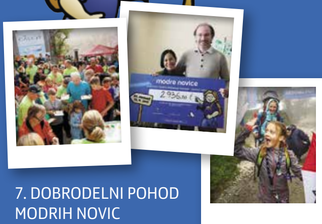
7. DOBRODELNI POHOD MODRIH NOVIC