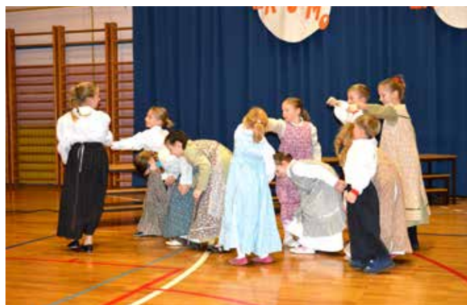
Mladi folkloristi od prvega do petega razreda, ki plešejo v šolski folklorni skupini, so predstavili del slovenskega ljudskega izročila.