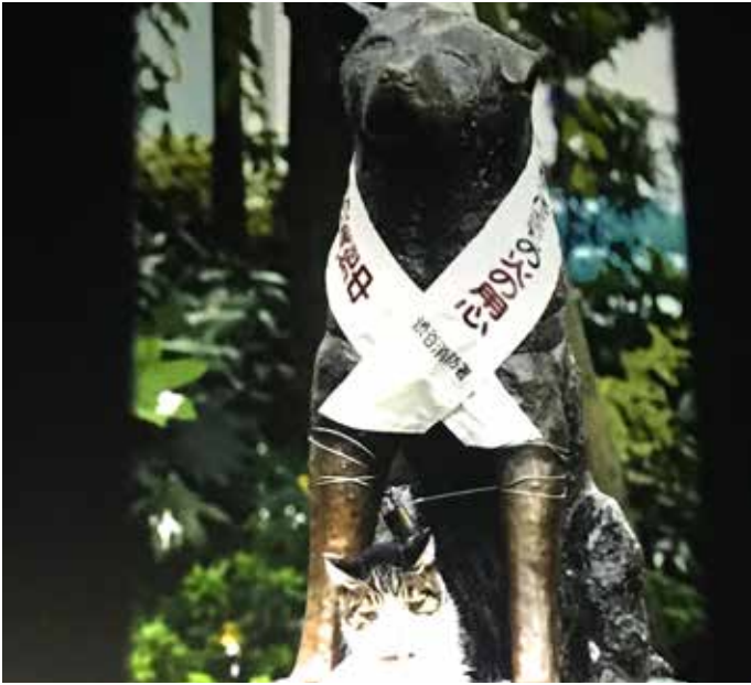
Spomenik slovitemu psu Hachiku, ki je kar osem let vsak dan zvesto čakal na svojega gospodarja pri najbolj prometnem prehodu za pešce na svetu, v tokijski četrti Shibuya.

Na hladen decembrski večer smo se na potopisnem predavanju odpravili v deželo mnogih nasprotij, na Japonsko, državo, ki nosi v sebi nekaj, česar druge države ne premorejo. Nekaj, kar je le japonsko. In to je njihova »japonskost«. Ta se kaže v kulturi belega riža, sušija, origamijev, ikeban, karaok, pa tudi v težkem zgodovinskem bremenu druge svetovne vojne, ki ga država še vedno nosi.