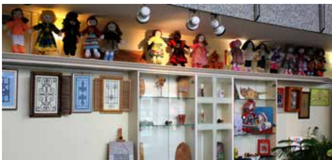
Razstavljene punčke iz cunj so s svojo ljubkostjo vabile k dobrotelnemu nakupu.