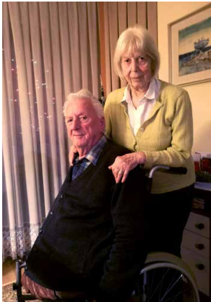
Zakonca Škedelj ostajata kljub težki življenjski preizkušnji tudi na jesen življenja optimista.

Nejc Lisjak, MDI Domžale, foto: Arhiv MDI Domžale