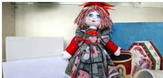
Špela Marjanca, ki jo je kupilo turistično društvo Kanja, kraljuje zdaj v vitrini Centra Ivana Hribarja.