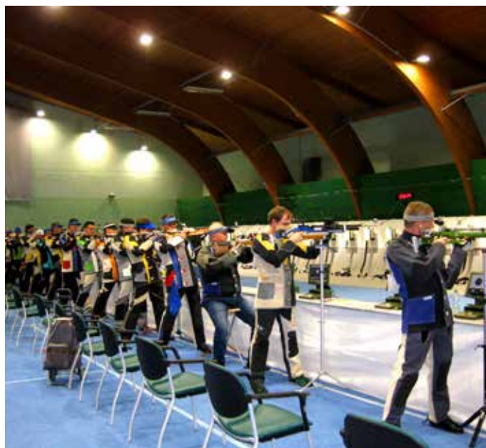
Članski tekmovalci v kategoriji zračna puška v akciji. V takšnem trenutku je ključnega pomena zbranost!

Tanja Bricelj, foto: Arhiv SD Trzin in Tanja Bricelj