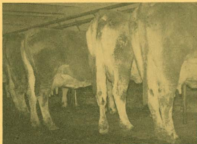
Več »repop« rediš, boljše stojiš