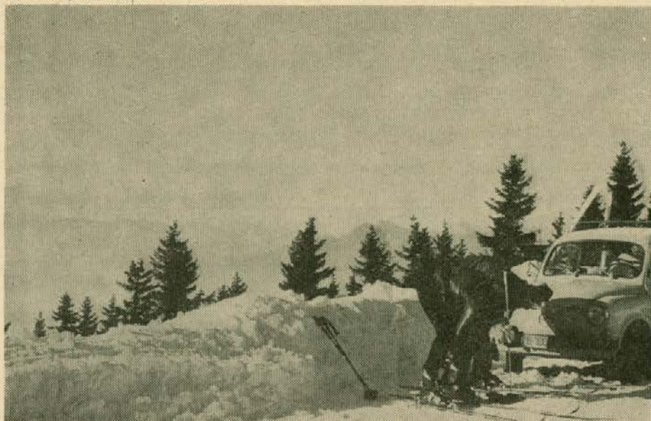
Zima na Pohorju

Izvoza v lanskem letu nismo dosegli. V prvem polletju nismo imeli naročil za stavbno pohištvo. V drugem polletju smo si pridobili nekaj naročil. Pri izvozu smo imeli tudi težave z reklamacijami. Manjši izvoz, kot je bil planiran, pa nam je prinesel manj deviz, kot smo jih načrtovali in rabili za nabavo repromaterialov in rekonstruk- (Nadaljevanje na 2. strani)