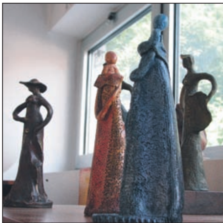
VK ulturnici sil ahkoo gledate tudiu metnišker azstave.

jejo, pa je Oder povedal: »Nekateri zase, to so predvsem zbiratelji, ki si ustvarjajo svoje knjižnice doma, veliko pa jih pride po knjigo za darilo. Ravno pred kratkim je k nam prišla gospa, ki je povabila nekaj ljudi k sebi domov, tu kupila čisto majhne knjižice in jih gostom podarila ob vinu. Zakaj ne?«