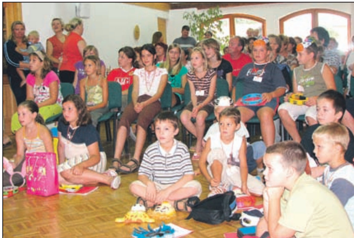
Z zaključne prireditve