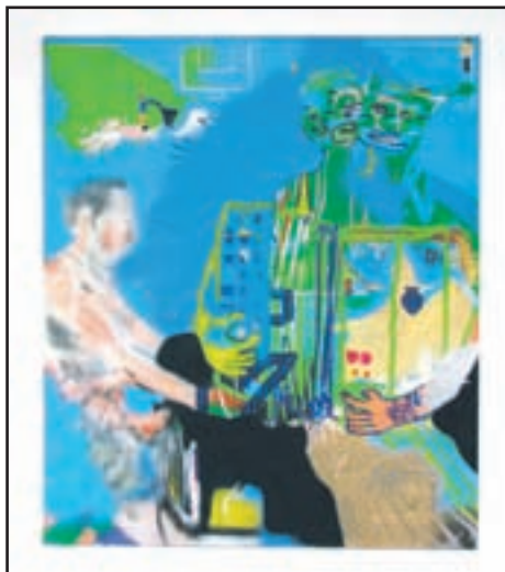
Eno odr azstavljenih del