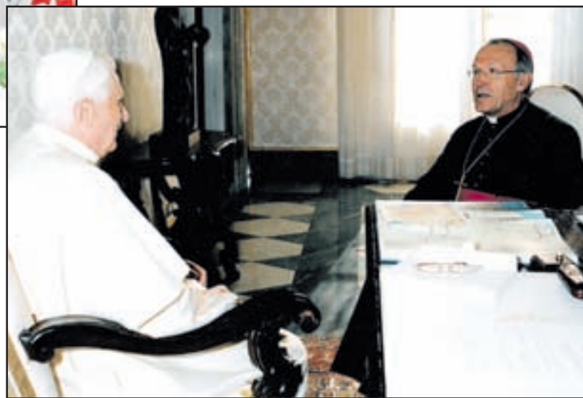
Škof Stres se jez ahvalilp apežu zau stanovitev novihš kofij.

Ker pa je to včasih težko, se na Škofiji Celje trudijo z različnimi projekti, v katere je seveda vključenih veliko več aktivnih kristjanov, kot smo jih predstavili v tem prispevku. Projekti in dobra ekipa vernih ljudi so recept, ki ga vsakodnevno izročijo Bogu, nato pa upajo, da bodo tudi drugi vendarle začutili, da so v službi ljudi. »S tem namenom je bila škofija tudi ustanovljena,« pojasnjuje Kužnik,