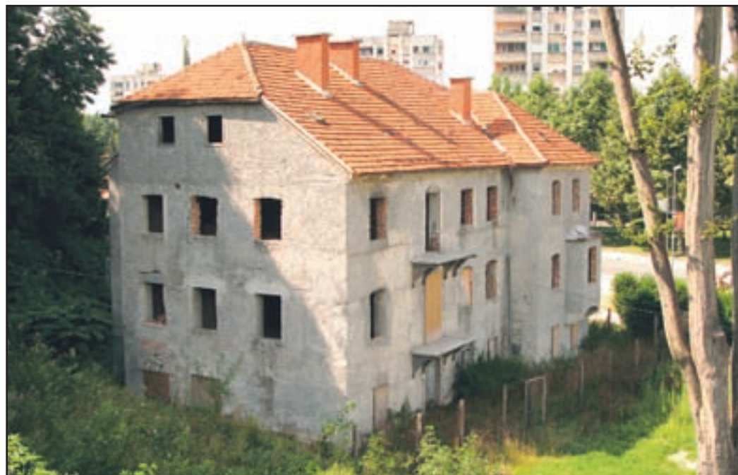
Vila Bianca danes

Pogodba za izvedbo prve faze prenove je bila podpisana januarja letos. Z njo je Mestna občina pridobila 755.435 evrov oziroma največ 85 % upravičenih stroškov. Prvo fazo projekta že izvajajo, trenutno so v postopku pridobivanja