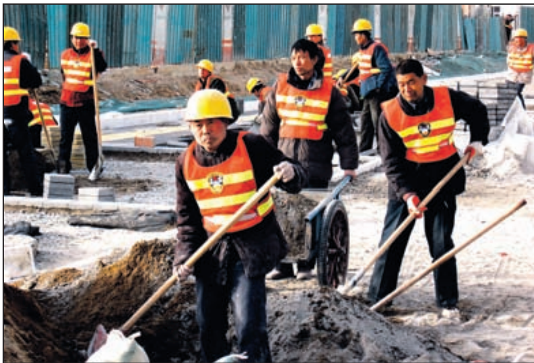
Kitajskid elavci soz nalip oprjeti za delo...

Na dolgem poletu nad Kitajsko, Rusijo in Evropo, ki je trajal več kot deset ur, so se nizali dogodki iz prometno nasičenih cest, avenij in ulic, čudežnih parkov in templjev ter palač, iz mestnih četrti, kjer rastejo nebotičniki in nebo kot gobe po dežju. A prizori s šolskih igrišč, iz učilnic in otroških igralnic so se najgloblje ohranili v spominih.