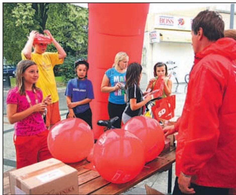
V torek je bilo ob mladih SD-jevcih največ najmlajših, ki so se posladkali s čokolado ali se zabavali z napihljivimi žogami.

V času predvolilne kampanije namerava Mladí forum, kot je dejal Ekart, predvsem podpirati stranko in prepričati mlade, da gredo na volitve, jim sporočiti, da je njihov glas pomemben.