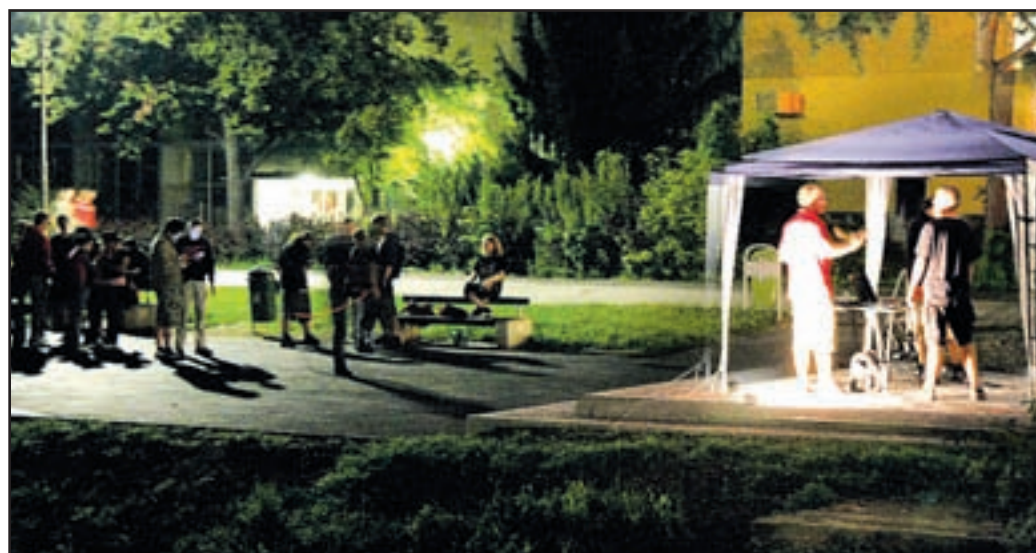
Vsak večer se vrtid ruğačna zvrstg lasbe.

nega projekta je vsak večer organizirano dogajanje, tematsko razdeljeno po tednih. Prvi teden so vrtili južnoameriško glasbo, potem je na vrsto prišel rock and roll, prejšnji teden filmska glasba, ta teden tehn.