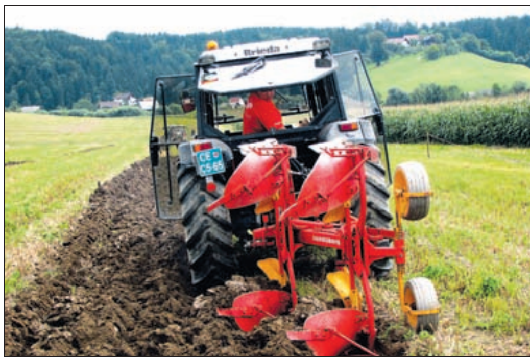
Oračic eljsker egije so se udarili nan jivik metijskez adrugeš aleškad olina vRavnah pri Šoštanj.

Tudi v prihodnje bodo organizatorji in udeleženci kmečkih iger po