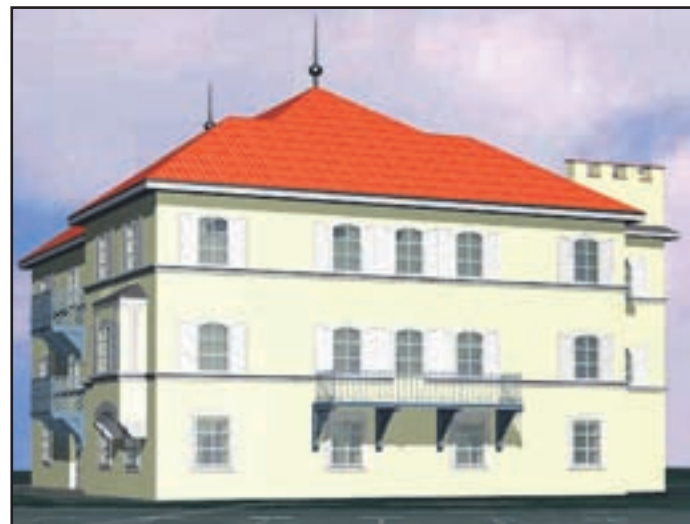
Vila Bianca po obnovi

»Z gotovostjo lahko trdimo, da bi se večji deli krošenj posušili, saj sta bila onemogočena črpanje ter pretok hranilnih snovi in vode. Rastline črpajo hranilne snovi in vodo z najtanjšimi koreninami, drastične poškodbe koreninskega sistema pa drevesa ne morejo nadomestiti. Črpanja vode in hranilnih snovi ne morejo nadomestiti niti druge korenine, saj določena korenina oskrbuje točno določen del krošnje. Hitro bi začele posušene veje ogroziti mimoidoče, saj so zelo lomljive. Gotovo tudi lastniki parkiranih avtomobilov ne bi bili veseli padajočih suhih vej. Prav tako je postala zaradi izvedenih zemeljskih del vprašljiva stabilnost drevesa, saj so bila drevesa zaradi poškodb slabo vsidrana v zemljo. Zaradi navedenih razlogov smo se odločili, da se drevored brez odstrani in se uredi nadomestna zasaditev,« pravi Dolejšijeva.