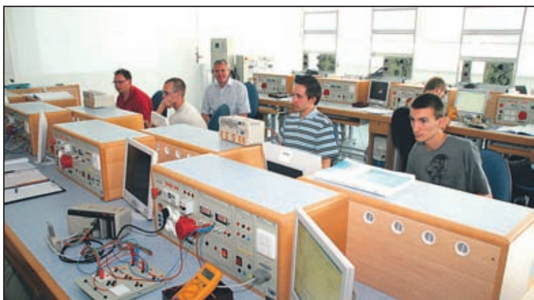
Grbp rejmejot udiP oklicna int ehniškar udarska šola, P oklicna int ehniškar trojna šola ter Poklicna inte hniškar elektro in računalniška šola Šolskega centra.

teorijo in prakso, ki jo njihovi dijaki opravljajo pri bodočih delodajalcih. V poklicni in tehniški elektro in računalniški šoli usposabljujejo za 14 poklicev, izobraževanje pa lahko nadaljujejo tudi na višji strokovni šoli, od prihodnjega šolskega leta pa se bodo lahko tudi na novoustanovljenih visokih šolah. Vse omenjene šole prisluhnejo potrebam gospodarstva, zato vsa leta uspešno organizirajo tudi izobraževanje ob delu.