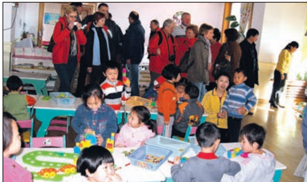
Opremljenost troškihi igralnic in igrišč povem arisikaj.

Nič manj nismo presenečeni, ko obiščemo enega od bližnjih otroških vrtcev. Praviloma gredo kita-