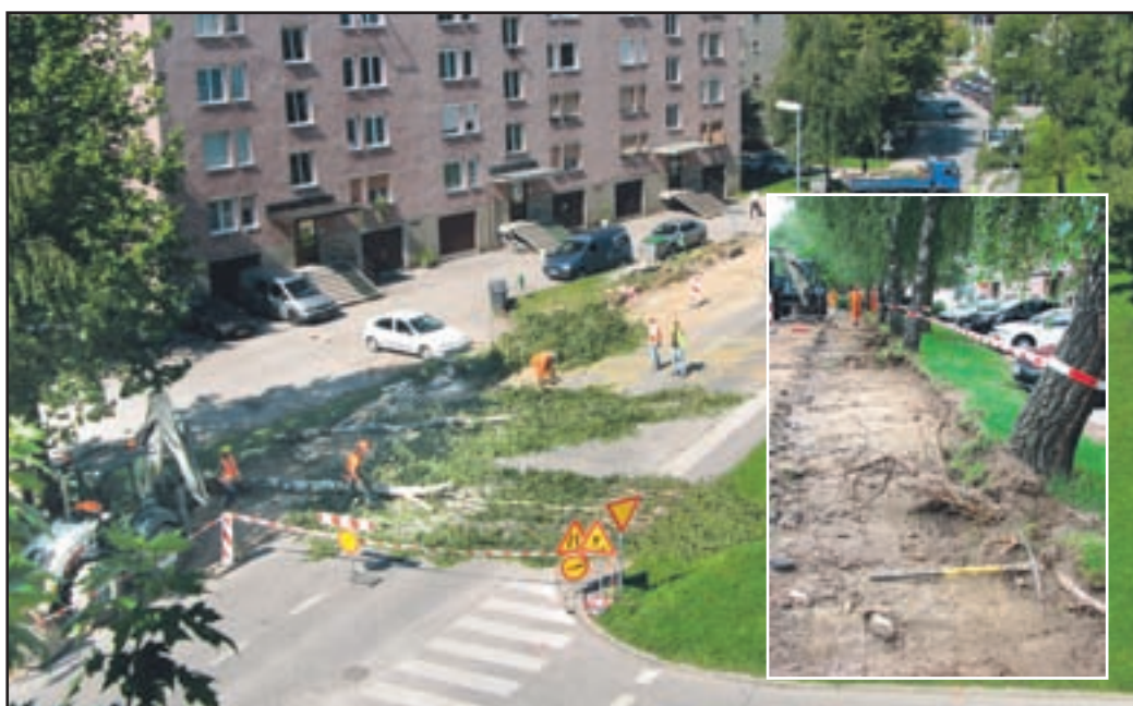
Tomšičevo že prenavljajo, podreti je bilo treba tudi precej dreves.

Krožišče pri nakupovalnem centru Jager je že urejeno, zdaj urejajo še cesto Simona Blatnika.