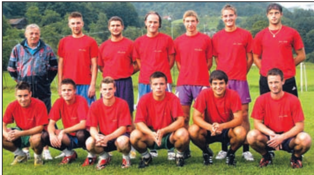
NKŠ martno1 928 st renerjemD ragomK ostajnskom

je pojasnil, so se v klubu v zimskem času sezone odločili, da bodo povabili k nadaljnjemu sodelovanju le igralce, ki želijo delati resno, izboljšati raven igranja, pomagati pri razvoju kluba ter nogometu v kraju. »Kljub prihodu novih igralcev naša klop ni dolga. Vendar mislim, da v tem trenutku ni toliko pomembno, koliko jih je, ampak da dres kluba nosijo pravi igralci. Nenazadnje je tudi cilj Šmartnega, da oblikuje mlado