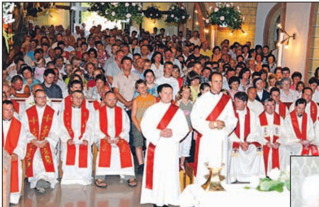
Prip osvečenju obeh novih duhovnikov Škofije je bilo zelo ljubosno.

V Škofiji so tako aktivno sodelovali na zahvalnem romanju novih škofij v Rim, nedavno so praznovali posvečenje dveh novomašnikov, pripravljajo duhovniška srečanja, ustanavljajo različne komisije, posebej skrbno spodbujajo molitev za duhovne poklice, usklajujejo delo po pastoralnem načrtu, gotovo pa ni naključje niti, da je vsa Slovenija letošnji slovenski katoliški dan obhajala prav v Celju.