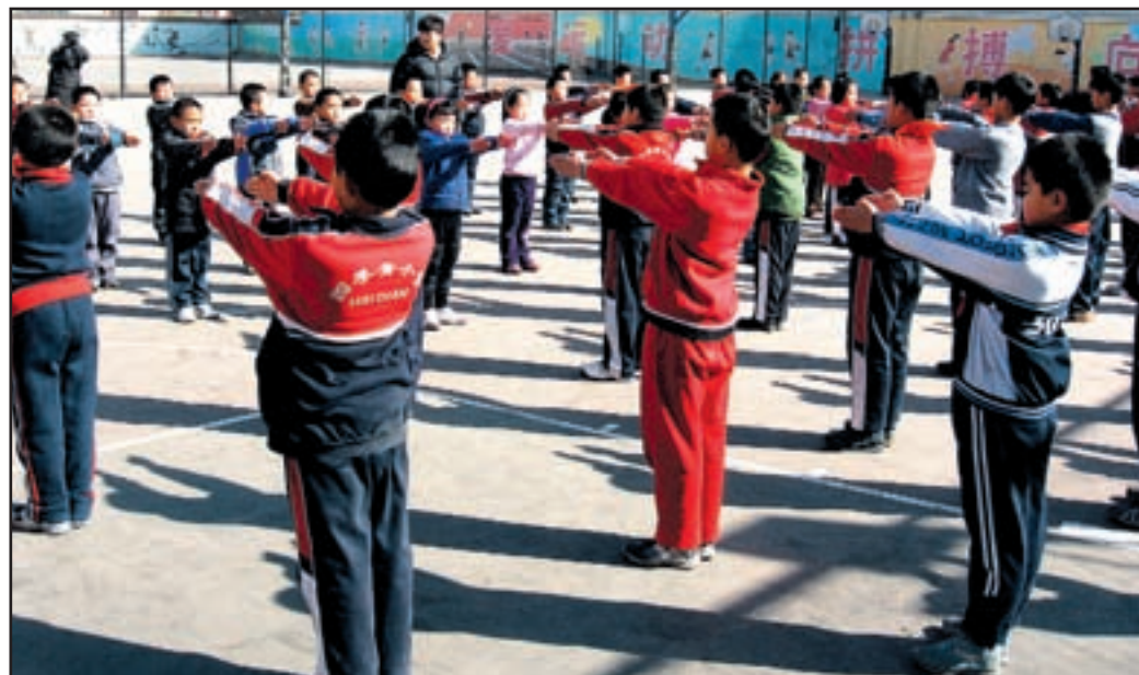
Vk itajskihno snovnih šolahn amenajot elovadbiv elikop ozornost.

že, avtomobilskih plaščev ipd. Presenečajo igrišča in majhna tartanska tletska teza.