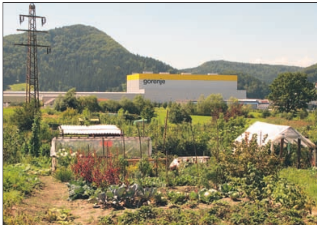
Tudi vrtičkarstvo se bo moralo v bodoče podrediti zakonodaji.

je oddaljene vsaj pol metra, dopustna pa je tudi postavitev ograje na parcelno mejo, seveda če se s postavitvijo strinjata oba lastnika.