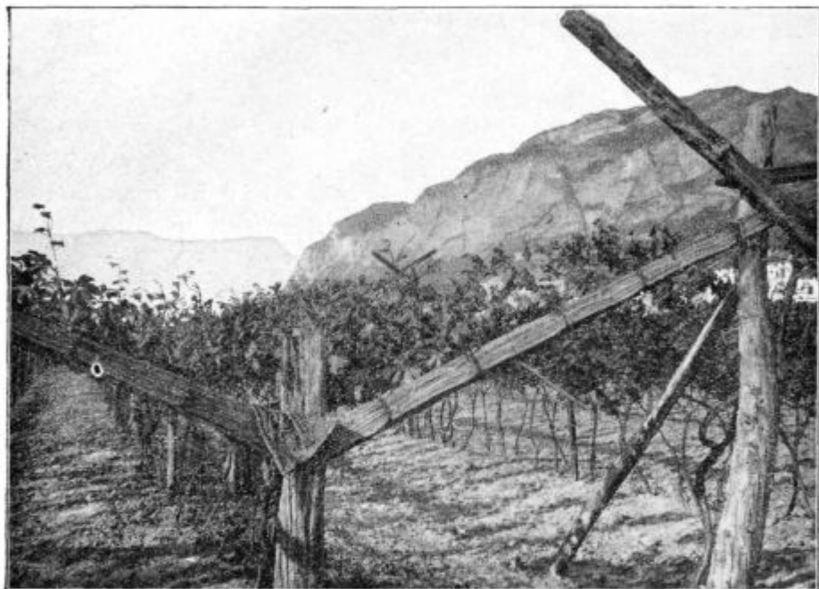
Pod. 14. Tirolski latnik na dve strani v ravnini.

Nasproti tem velikim prednostim, ki se ne dajo oporekati, treba je pa postaviti velike troške, ki jih imamo za prvo napravo latnikov in so mnogo večji od onih, ki jih imamo pri vzgoji na špalir ali v red. —