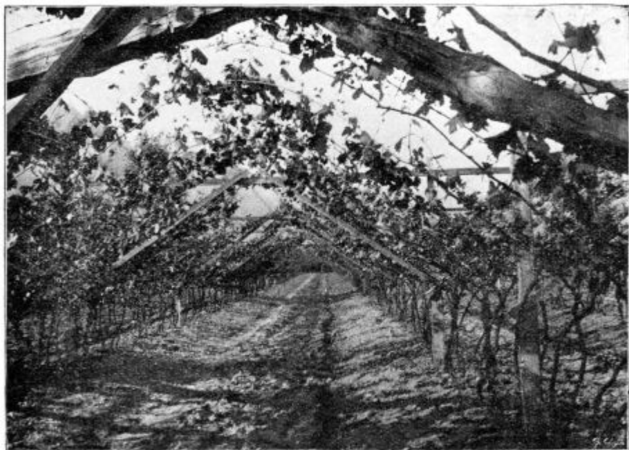
Pod. 15. Tirolski latnik na dve strani v ravnini.

Razun tega je razlika tudi v tem, kako se nastavijo latniki enega za drugim: lahko se nasloni prvi na drugega tako, da ni med njimi še posebnega prostora ali pa so med seboj bolj oddaljeni in se nahaja med njimi prostor za druge pridelke (mešano pridelovanje).