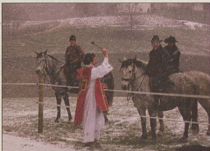
Žegnanje na Gorici pri Brestanici

Žegnanje konj so pripravili še v Pišecah pri cerkvi Sv. Mihaela, v Nemški vasi pri cerkvi Sv. Štefana in na Vranju. L.Z.