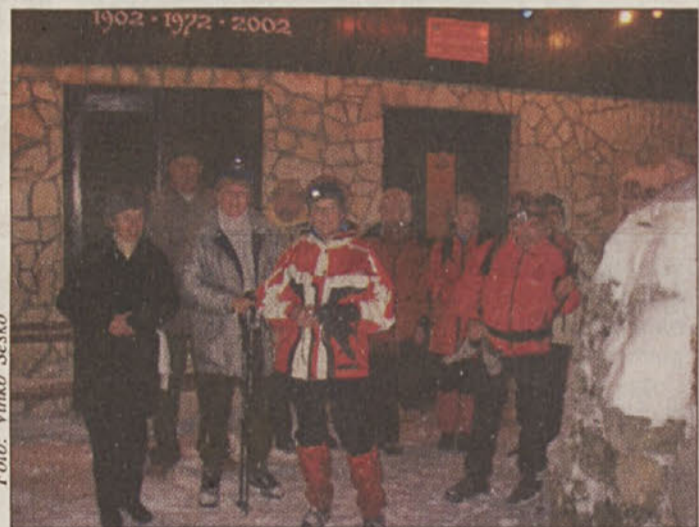
Nočni pohodniki, ki so prišli na Lisco.