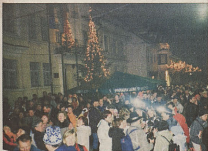
Veselo razpoloženje na brežiških ulicah

pa glede na vrvež obiskovalci očitno niso bili pripravljeni. Skupaj z vodjo ansambla so odšli zadnje minute leta 2005, nato pa so si dali duška tere so zmotile dežne kaplje in so se kar prehitro poiskali streho, najbolj "trpežni" pa so vztrajali do zgodnjega jutra. B.D., N.Č.C., J.K.