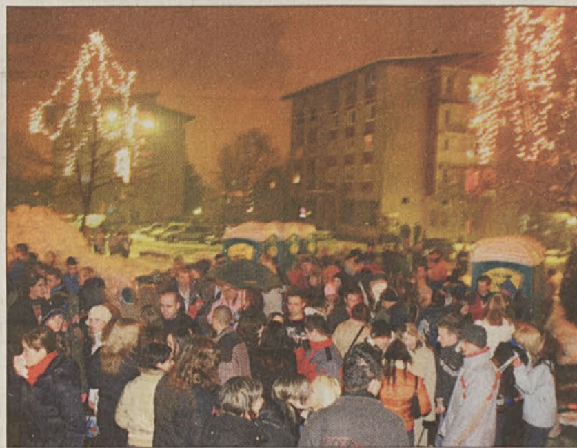
...na strani 3 Silvestrski utrip v Krškem

Posavje - Silvestrovanje na prostem je nekaj čarobnega, posebno doživetje, je bilo slišati v mnogih izjavah zadnje dni preteklega leta. Da to res drži, že nekaj let dokazujejo tudi Posavci, ki se na silvestrovo množično zberejo v mestnih središčih na že tradicionalnih silvestrovanjih; v Sevnici na trgu, v Krškem pri Matiji Gubcu in v Brežicah med občino in Santa Lucijo. Zabave in vesele družbe željni so prišli na svoj račun, povsod so za to poskrbeli glasbeniki, tu in tam je bilo opaziti kakšnega, ki je preveč globoko pogledal v kozarec in omagal, večjih izgredov pa ni bilo. Ob polnoči so zacmokljali poljubčki, slišati je bilo najrazličnejša voščila in oči so se naužile lepote ognjemetov, njihove iskricice so bile tudi edine zvezdice na nebu ta večer, saj je kmalu po polnoči začelo deževati.