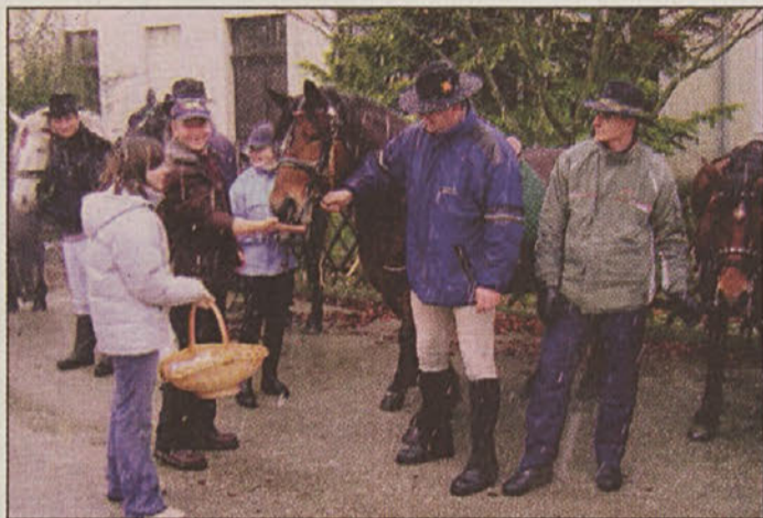
Žegnanje v Kapelah