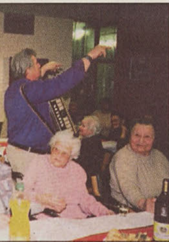
V brežiškem domu starejših so se razveselili obiska brežiškega župana.

Ob takih obiskih je lepo spoznanje, da je za večino teh ljudi najpomembnejši le prijazen nasmeh, stisk roke in iskrene želje ob prihajajočih praznikih. L.Z.