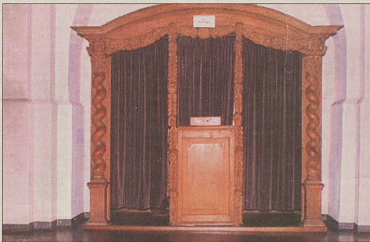
...na strani 5 Tudi spovednica ne bo omilila njihovih grehov...