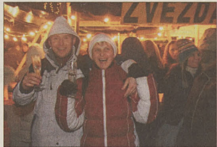
Razposajeni Krčani nazdravili novemu letu.

Številni pohodniki so se kmalu po polnoči odpravili proti Lisci. Ti so imeli srečo z vremenom. Tiste pa, ki so