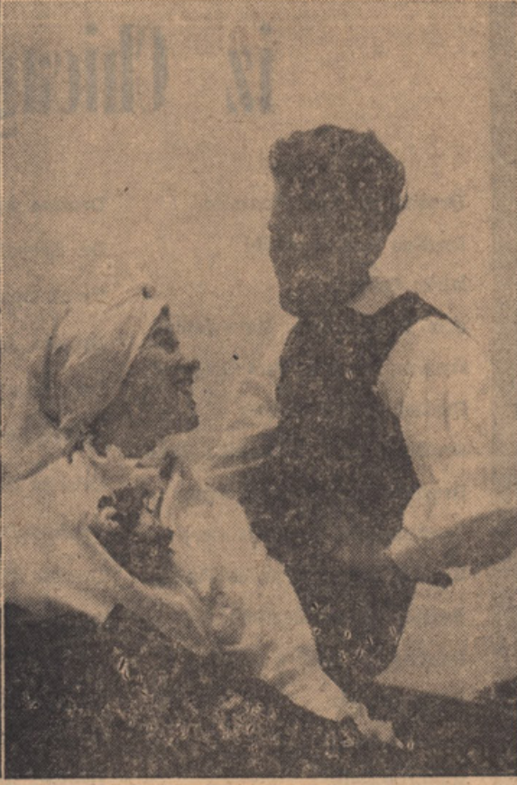
TRZASKA NARODNA NOŠA