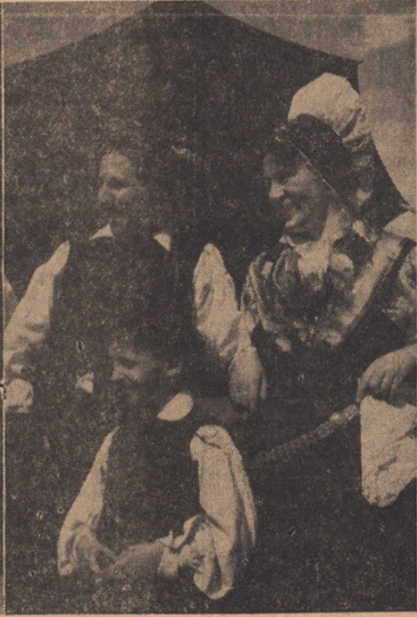
SLOVENSKA NARODNA NOŠA