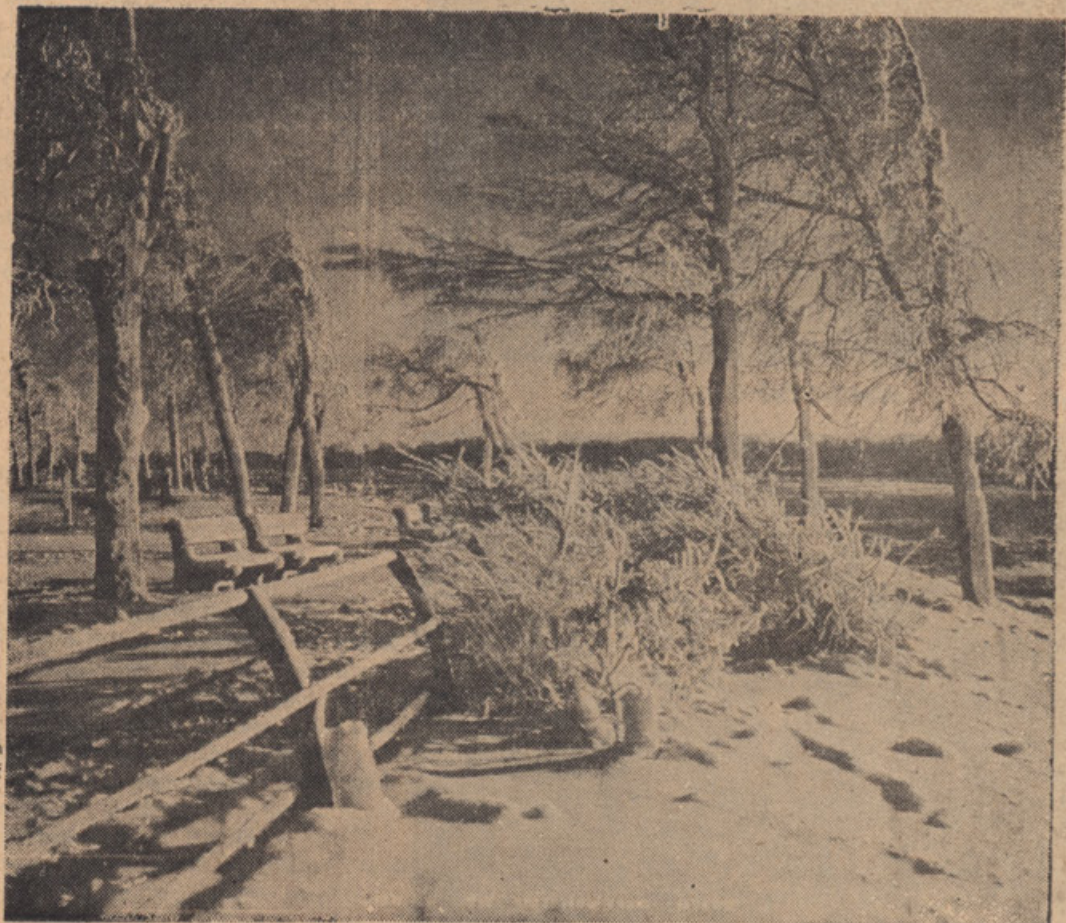
SLOVO OD KANADSKE ZIME