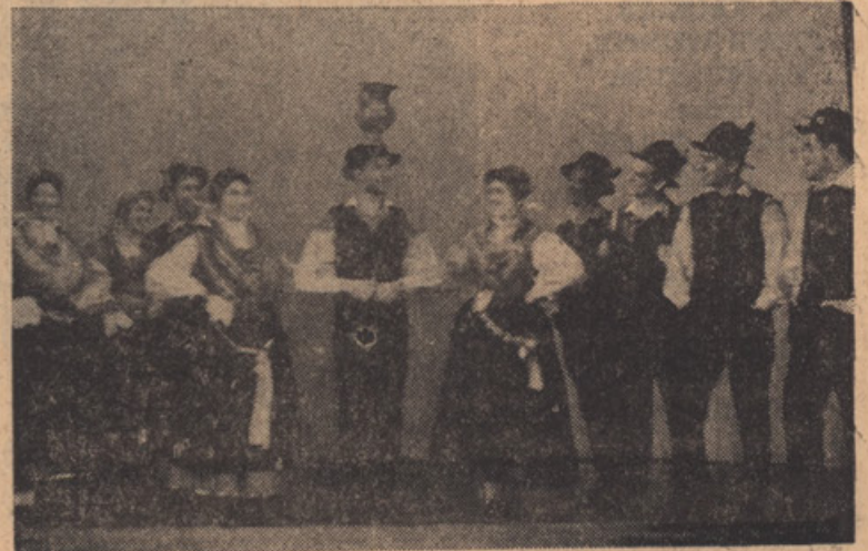
PLES Z MAJOLKO