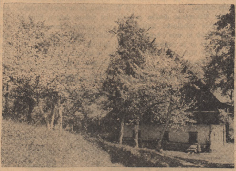
POMLAD PRIHAJA V SLOVENIJO

● St. Oče je odpovedal vse javne slovesnosti za praznovanje obletnice svojega kronanja za papeža, ker je italijansko državno sodišče obsodilo škofa Fiordelija iz Prata, ki je označil dve osebi kot "javna grešnica", ker sta se poročila izven cerkve.