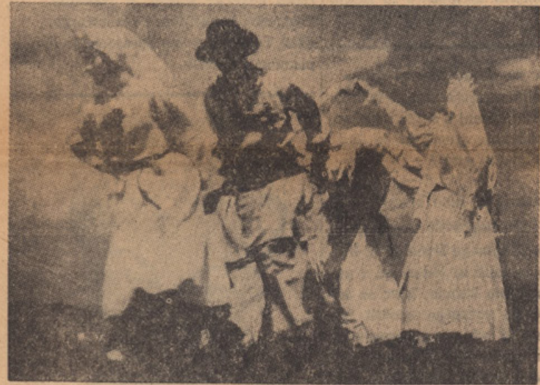
METLIŠKO OBREDJE — MOST

METLIŠKI MOST Al je kaj trden to vaš most? Preroža, roža prungarjena. Triji je kot kamen kust. Iz česa ste ga zidali. Iz zlata srebra delali . . .