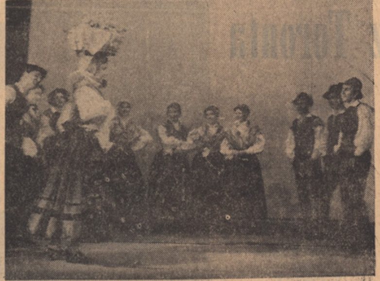
PLES Z JERBASOM