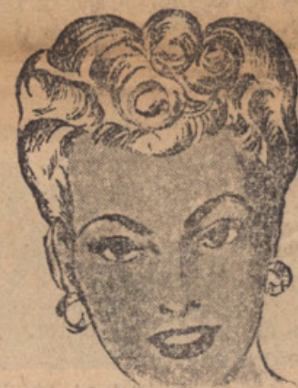
MARY LINDA BEAUTY SALON

6113 St. Clair Ave., Cleveland 3, Ohio, Telef. EX. 1-8787 ureja vse potrebno za potovanje v domovino in druge dežele. Preko trdke Bled lahko pošljete svojim domačim živilske pakete, denar, šivalne stroje, radio aparate, kolesa in podobno. Postrežba zanesljiva, cene zmerne. Bled Travel Service sprejema tudi pismena naročila.