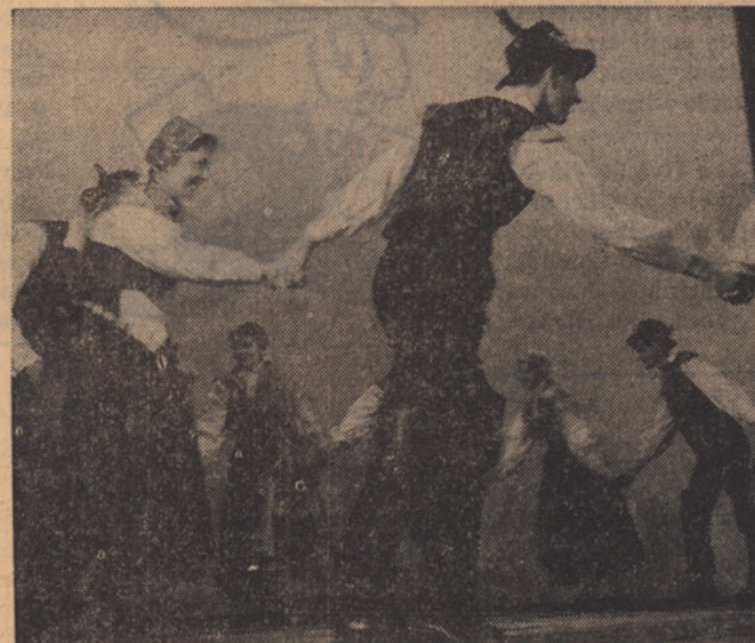
SLOVENSKI NARODNI PLES

REZIJANKA Ko na nardo pridimo, te naše mlade bidimo, te naše mlade Rezijankice, ki majo kratke jankice. Kratka janka, kradek pas, kir rase triebe ven čies pas. Lala, lala . . .