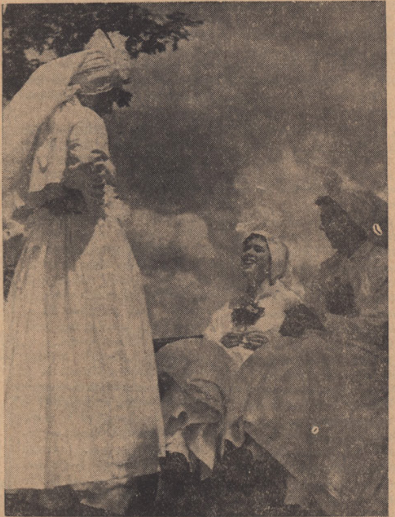
POČITEK PO PLESU — SLOVENSKA NOSA IZ BELE KRAJINE. REST AFTER THE DANCE. — SLOVENIAN NATIONAL COSTUME FROM BELA KRAJINA

... In 1930, at the fair at Maribor, the first Slovene Festival was held, on which occasion dance-groups from Bela Krajina, ... scenes and dances. Thus these people from various parts of country became conscious of being children of the same people, countrymen and — women with a common fate.