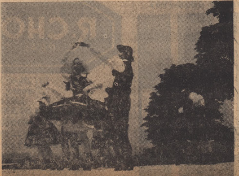
VISOKI REJ (ZILJA)