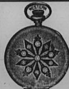
Pišite po cenik.

KDOR hoče dobro. ceno blago in si stem prihraniti denar, kupuje naj žepne in stenske ure; veriice in sploh zlatnino pri