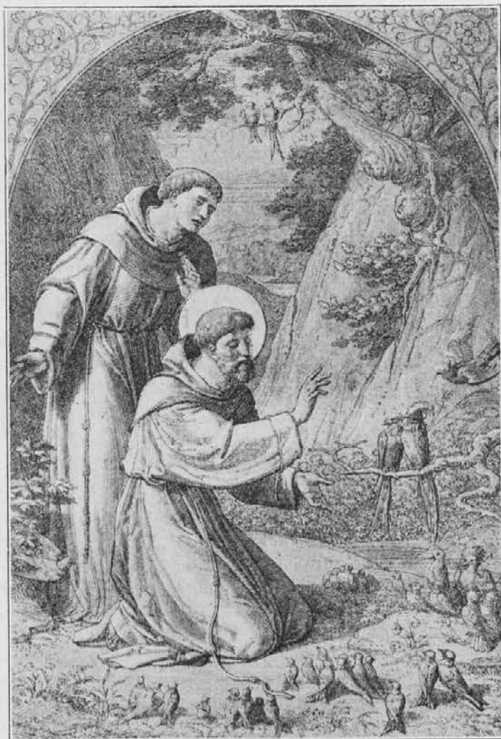
— Sv. Frančišek —

sliši, kako naju brat slavček poziva, da ž njim slaviva Boga? Morava mu pomagati!" Brat Leon se začne opravičevati, da ima slab glas in je prosil svetnika, naj poje sam. Frančišek se previdno približa slavčku in začne prepevati. Njegov zvonki glas je odmeval po gaju in himna se je dvigala k Stvarniku v nebo. Slavček neha in poslušna in ko je svetnik nehal, je slavček nadaljeval. Nekaj časa se vrstita, dokler Frančišek ne vzklikne: "Zmagal si, brat slavček, zmagal si, prekosil si me!" In poln veselja je občudoval miloglasno ptico.