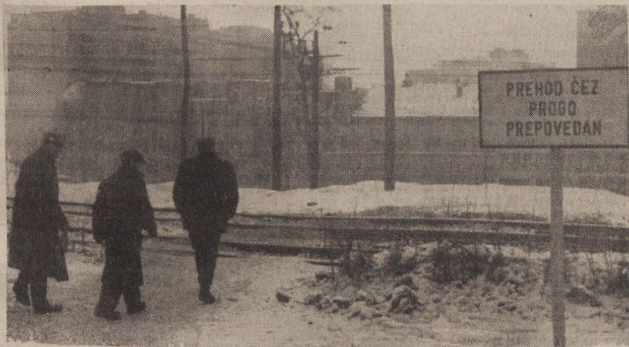
Odkar je začel delovati podvoz na Titovi cesti, je Parmova ulica postala slepa. To pomeni, da se konča pri železniških tirih. Železniško podjetje Ljubljana je z obeh strani opremilo nekdanji prehod z vidnimi tablami, na katerih jasno piše: PREHOD ČEZ PROGO PREPOVEDAN! Res da bi bila visoka ograja boljše sredstvo za zavarovanje proge; toda kakor železniško podjetje smo tudi mi mnenja, da ti dve tabli zadosti opozarjata na nevarnost prehoda preko tirov. To pa nikakor ne skrbi nekaterih ljudi, ki kar mirno prehajajo čez progo. Ko bo prišlo do nesreče bo prepozno, zato menimo, da bi nekdo kršilce lahko na mestu kaznoval z denarnimi kaznimi ali pa jih prijavil sodniku za prekrške