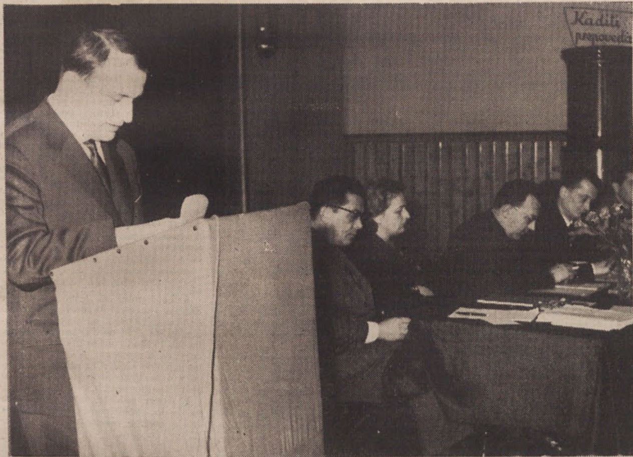
Z občinske konference SZDL: delovno predsedstvo

GLASILO SOCIALISTIČNE ZVEZE DELOVNEGA LJUDSTVA OBČINE LJUBLJANA-BEŽIGRAD