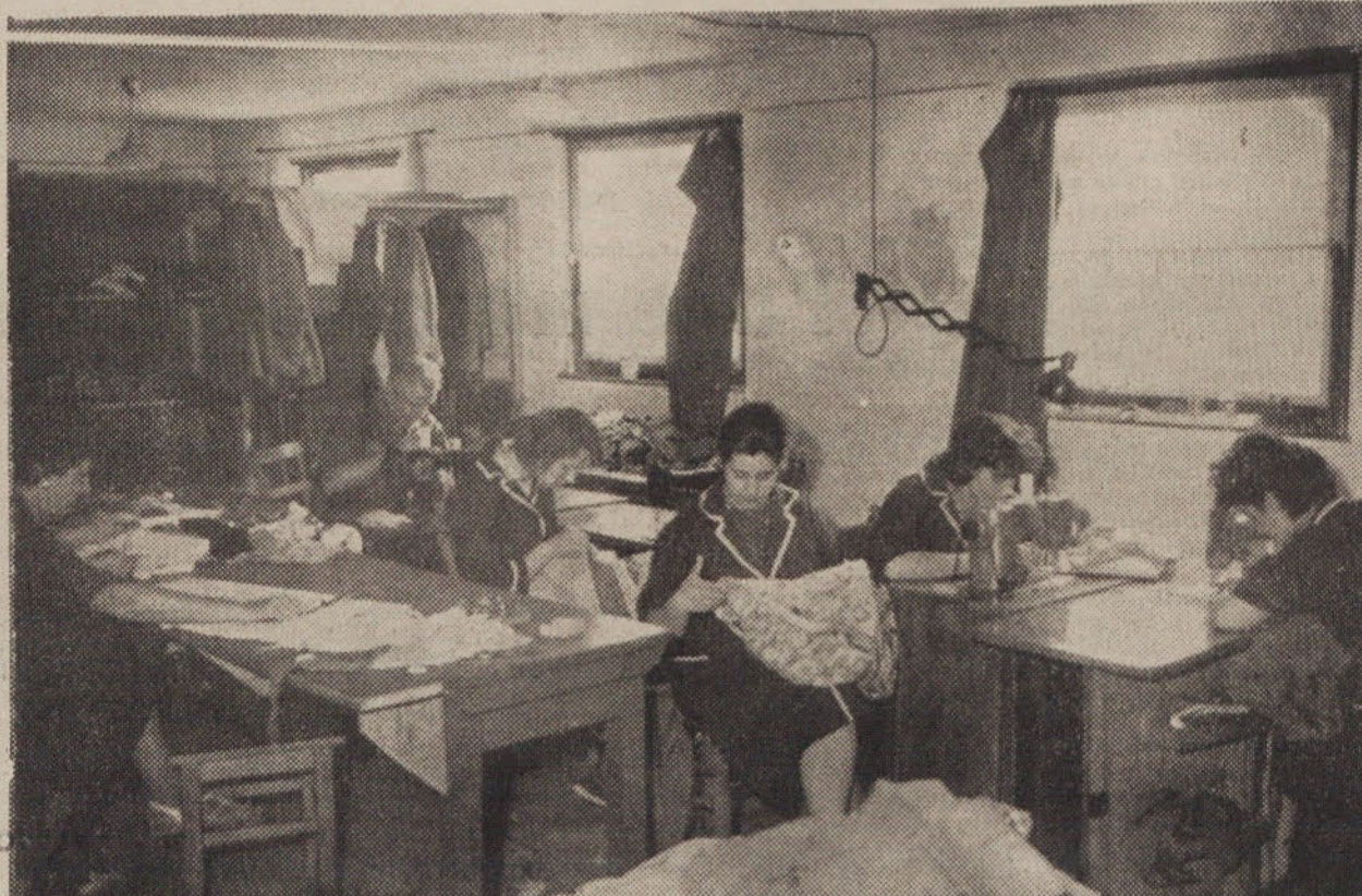
Servis-šivalnica v Savskem naselju