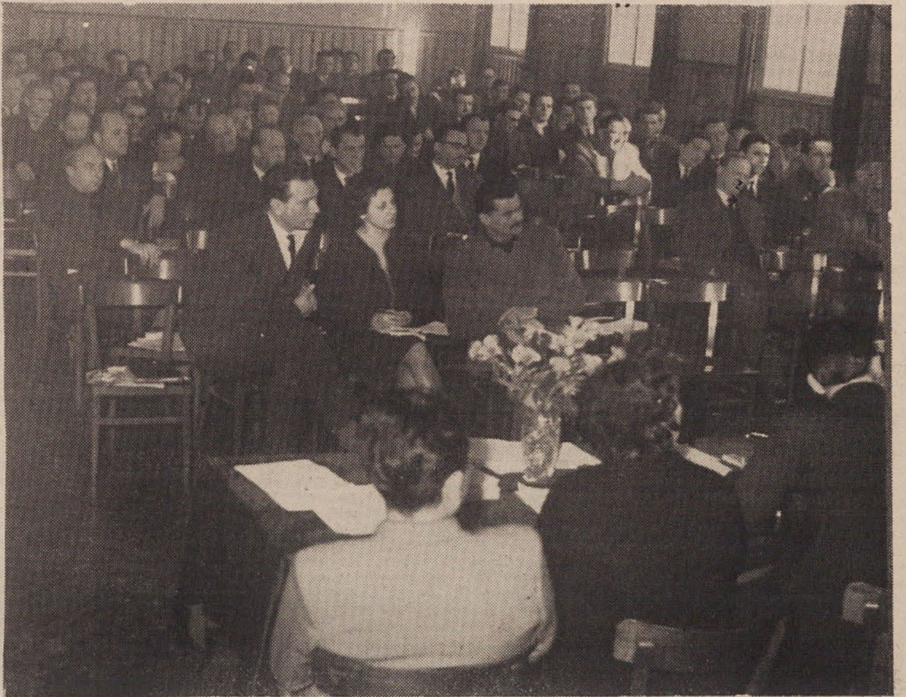
Z občinske konference SZDL: delegati poslušajo uvodni referat

Posebno poglavje neposredne pomoči in reševanja konkretnih zadev ter odnosa do občanov so prošnje in pritožbe posameznikov. Če pogledamo poročilo komisije za prošnje in pritožbe občinskega ljudskega odbora, bi lahko sklepali, da prošnje in pritožb ni. Komisija je namreč v letu 1961 imela dve seji in obravnavala le dve zadevi, v letu 1962 pa je na treh sejah obravnavala štiri zadeve. Vse zadeve so