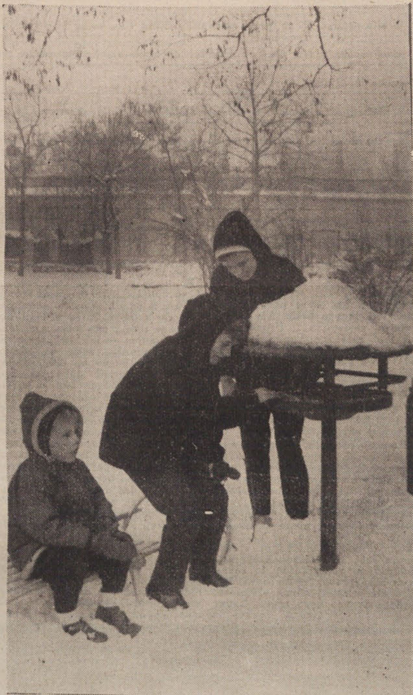
Da ptički ne bodo lačni...