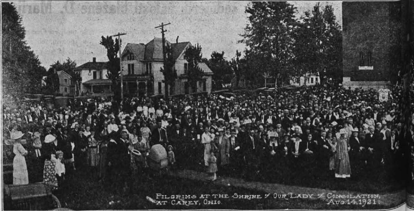
PILGRIMS AT THE SHRINE OF OUR LADY OF CONSOLATION, AT CAREY, OHIO. AUG. 14, 1921.

5. Peto žalost je občutila prečista Devica, ko je gledala, kako je bil