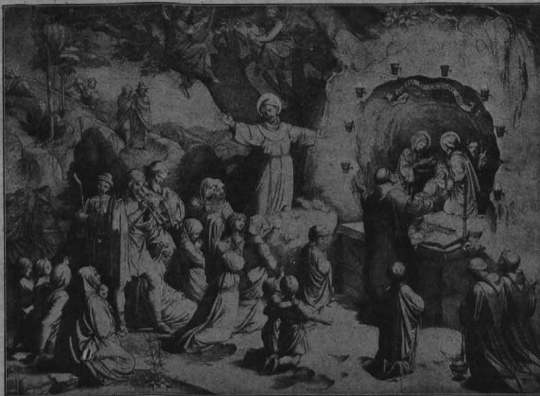
Prve jaslice sv. Franciška.