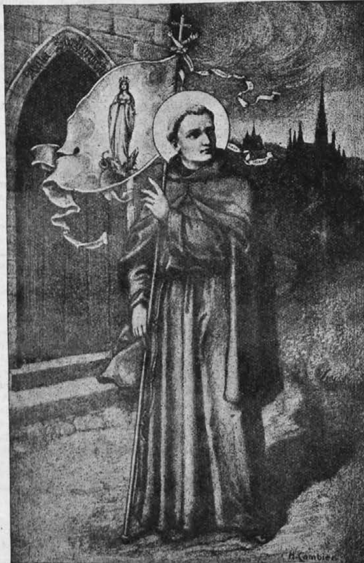
D. Scotus, frančiškan, brani Brezmadežno

naj se vesele in radoste pri podobah, četudi se marsikaj za tisoč ali dva- tisoč let ne vjema; ne smejte se — vse ima svoj pomen; tudi mi sami želimo, da bi bila naša podoba med temi, ki so zbrani okoli jaslic.