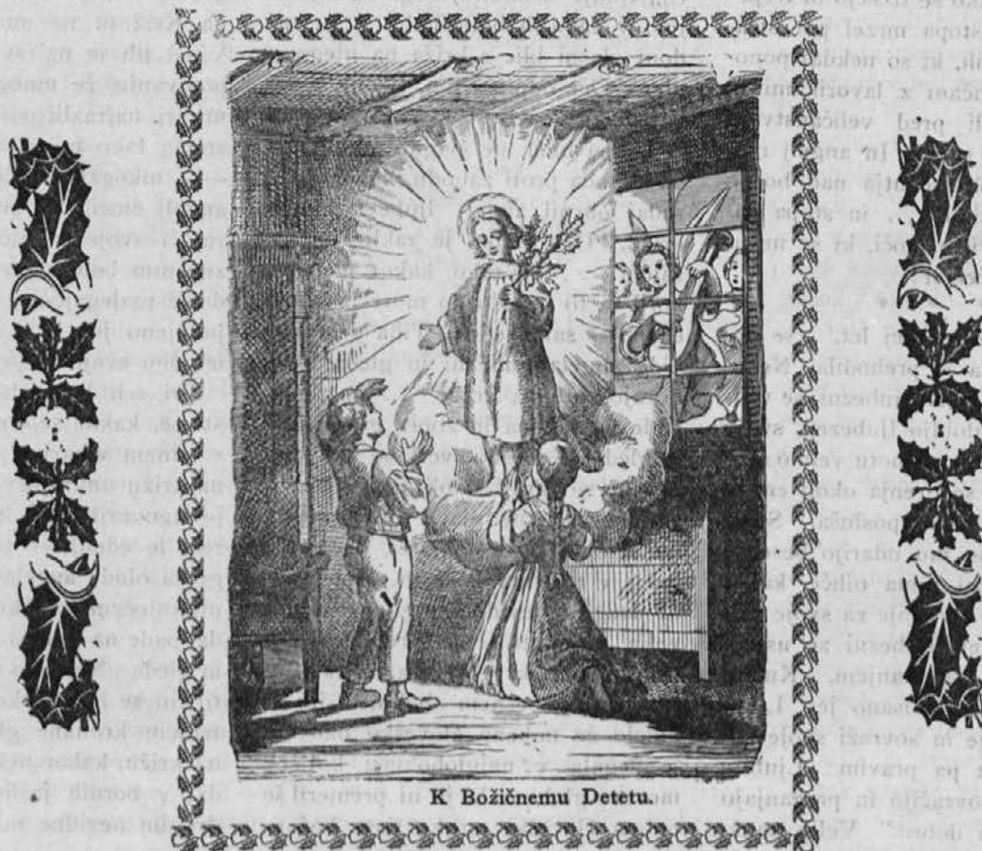
K Božičnemu Detetu.

In kadar zvone ob polnoči zvonovi, stojita tudi pred teboj oba angela nebes. Angelj moči hoče blagosloviti tvoje čelo za junaški boj, angelj ljubezni pa želi globino tvojega srca in tvoje duše odpreti Odrešeniku sveta.