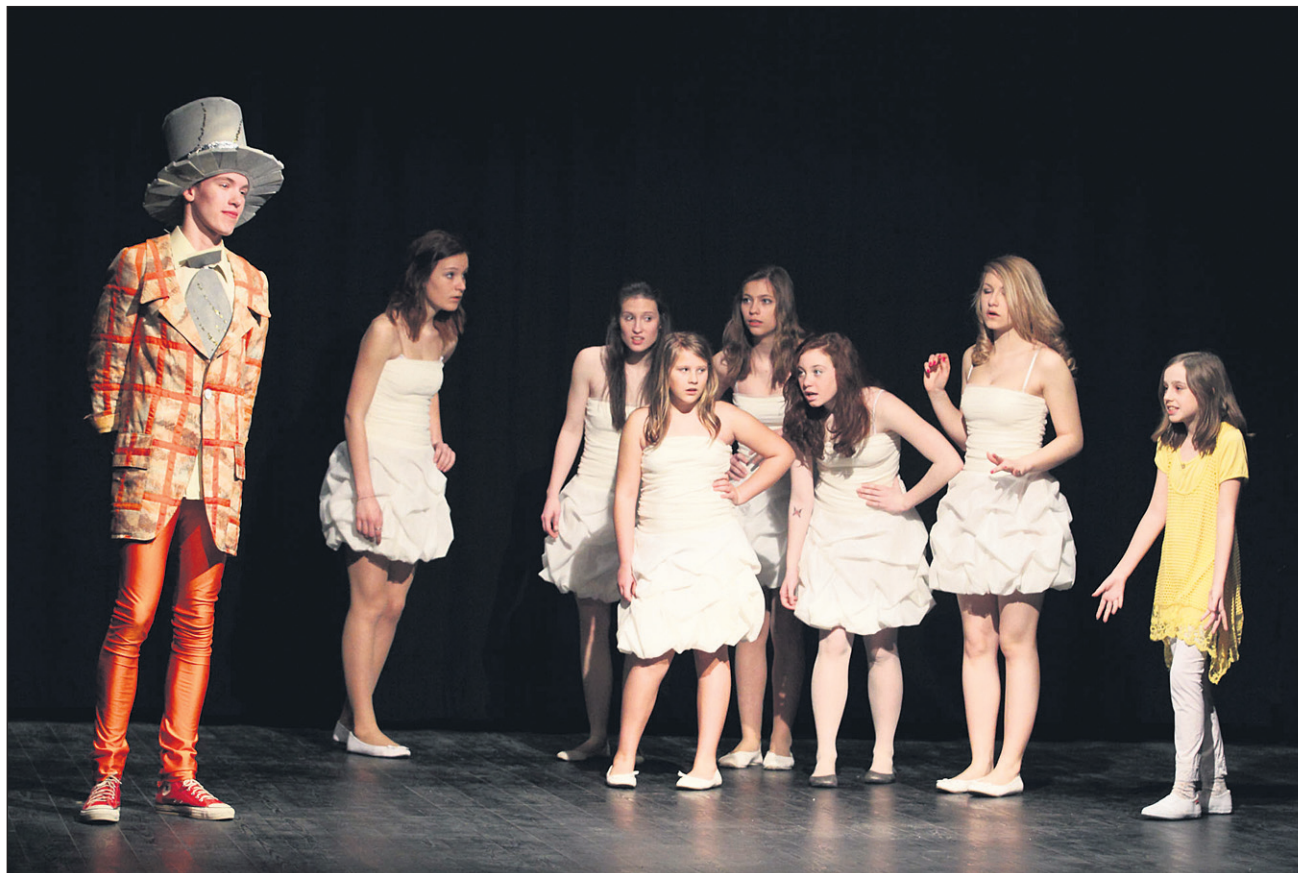
Letošnjega srečanja se je udeležilo deset otroških gledaliških skupin. Na fotografiji Zvezdica zaspanka gledališkega studia DPD Svoboda Ptuj.

Mali človek pa vse to tiho opazuje in ne reče nič. Ker je prepričan, da dokler ne plača vseh položnic, zadovolji apetitov države in še koga, ni izpolnil svojih dolžnosti. Zato tudi nima pravice, da se oglašča.