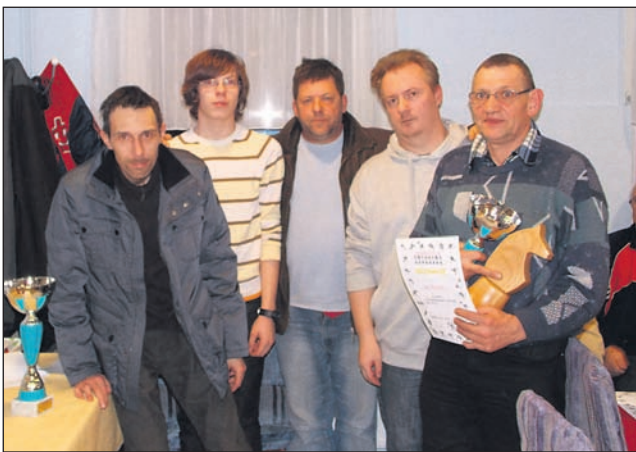
Drugouvrščena ekipa Bar Ring Ptuj