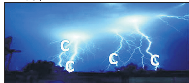
Avtor: Edi Klasinc

Rešitev iz prejšnje številke: SAMO HRIBAR MILIČ