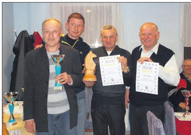
Ekipe Sivi panter Juršinci je zasedla 3. mesto.