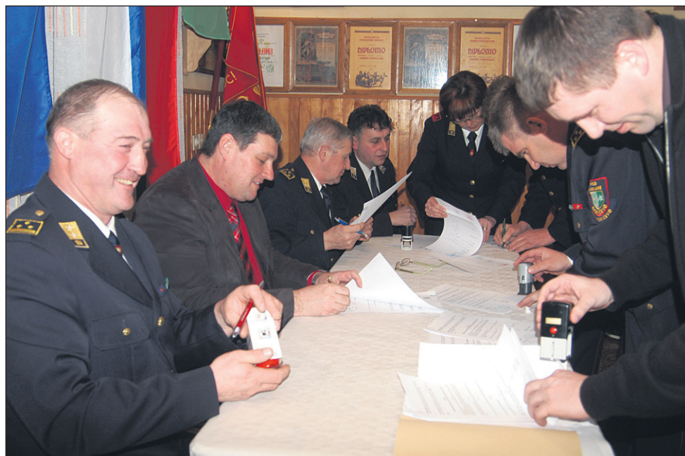
Na skupščini v Jablanah so slovesno podpisali tripartitno pogodbo o opravljanju gasilske dejavnosti med občino, gasilsko zvezo in vsemi osmimi gasilskimi društvi v občini.

Ob vsem tem so se udeleževali plenumov GZ Slovenije, sodelovali na posvetu članic v Termah Dobrna, na posvetu mentorjev gasilske mladine v Zrečah, redno so sodelovali na sejah podravske regije, uspešno pa so sodelovali tudi z drugimi društvi na območju občine Kidričevo. V letu 2012 je deset kandidatov uspešno zaključilo tečaj za vodjo enote, nabavili pa so tudi 20 za-