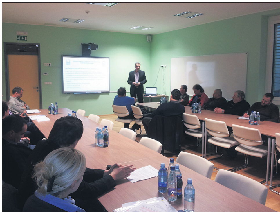
Okrogle mize podjetnikov, ki jo je organiziralo vodstvo občine Podlehnik, da bi ugotovilo, kakšne so potrebe domačih podjetnikov in kako naj temu sledi občinski razpis za podjetništvo, za katerega je namenjenih 15.000 evrov, se je udeležilo 18 domačih podjetnikov in obrtnikov, med njimi vsi največji.

Po statističnih podatkih oz. rezultatih smo imeli v Podlehniku konec leta 2011 s 14,2 % najvišjo stopnjo brezposelnosti, sledil je Videm z 12,8 %, Markovci z 10,2% in Žetale z 9,6%. Nadalje je ugotovljeno, da ima Podlehnik 47 podjetij na 1000 prebivalcev, Markovci jih imajo 66 na 1000 prebivalcev, Videm 42, Žetale