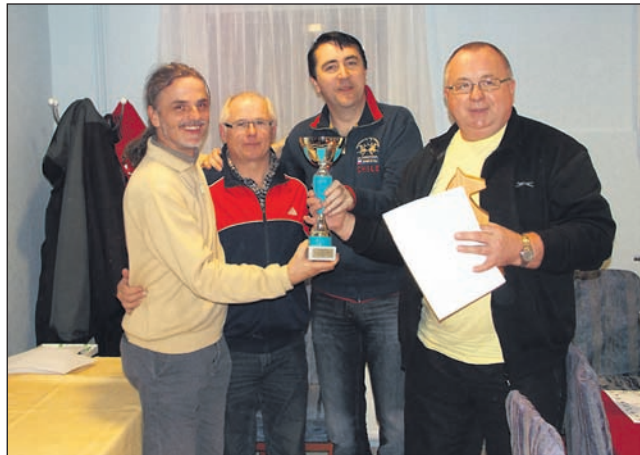
Zmagovalci letošnje slovenskogoriške šahovske lige so postali člani ekipe Bar Desetka Leskovec.

Z zaključnim turnirjem v hitropoteznem šahu (9 krogov – švicarski sistem), na katerem je sodelovalo 39 šahistov, se je preteklo soboto v Spuhlji končala letošnja Slovenskogoriška šahovska liga (SGŠL).