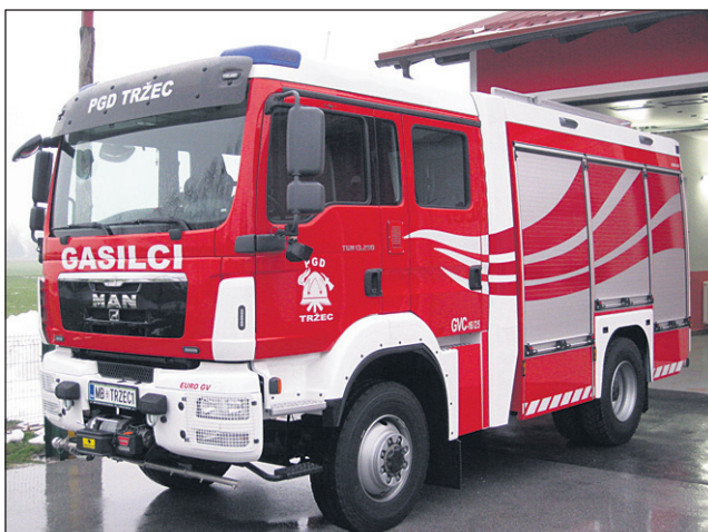
Novo gasilsko vozilo s cisterno GVC 16/25 MAN TGM 13.290 4x4 BL