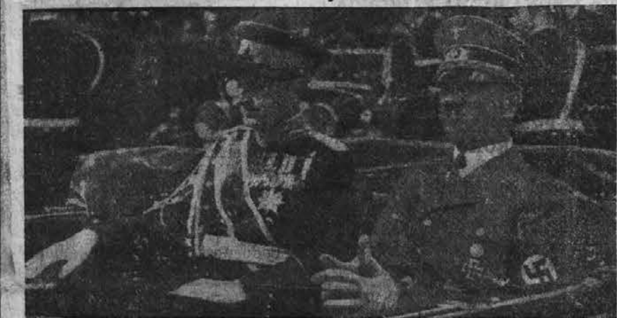
Namestnik Pavle v spremstvu Adolfa Hitlerja

Vsem je znano, da je bil češki delavec izmed najbolje stojčih v Evropi ter niti za časa svetovne krize pred leti, ki je bila zajela vse države, ni čutil pomanjkanja, s česar sklepamo, da češki delavci niso vpriporili nobene stavke. Sedaj pa se češkemu delavcu ne ljubi delati, ker ne ve za koga bi se trudil, ter na vse načine sabotira tvrdke in fabrike. So pa tudi mnogi Nemci, ki simpatizirajo s Čehi, zato ima nemška tajna policija obilo posla za vzdrževanje kontrole ter so deportacije ne samo Čehov marveč tudi Nemcev v koncentracijska taborišča na dnevnem redu.