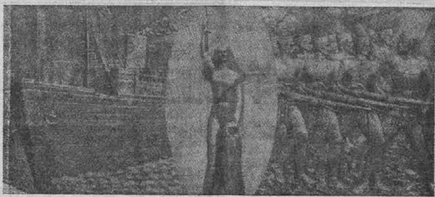
Spomenik črnogorskim ameriškim dobrovoljcem, ki so dali življenje za svojo domovino

Meteorološki zavod na univerzi je do 9. maja prejel nad 40 poročil iz raznih krajev Slovenije o zadnjem potresu, ki je napravil zlasti v Litiji veliko škodo, saj je nad 600 hiš več ali manj poškodoval. Škodo v Li-