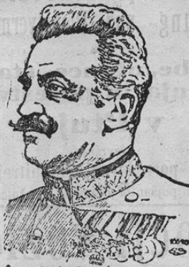
Generalmajor Ritter Höfer v. Feldsturm

V telegramih iz naših bojišč podpisan je ponavadi namestnik šefa generalštaba generalmajor Höfer. Danes prinašamo sliko tega odličnega vojaka.