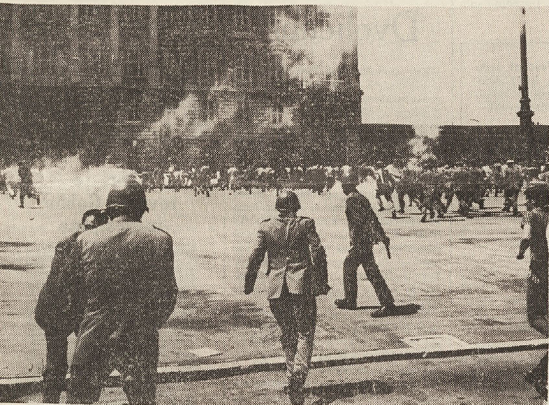
Prizor iz sobotnih dogodkov na tržaških ulicah. Policisti v bojni opremi razganjajo mladino, ki demonstrira