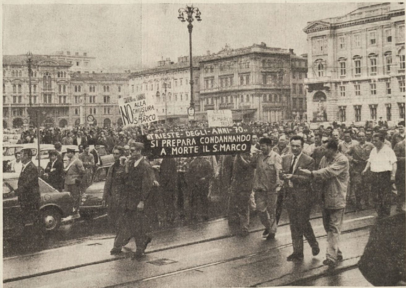
Demonstracija na Velikem trgu. Delavci so v sprejedu nosili krsto, ki ponazoruje smrt ladjedelnice Sv. Marka in ladjedelske industrije sploh.

V sredo je bila na sedežu federacije KPI v Trstu tiskovna konferenca, na kateri so naši parlamentarci ponovno objasnili stališča komunistov glede rešitve krize v Trstu.