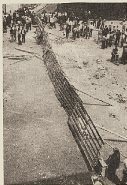
Značilna barikada na Trgu Barriera

Zaradi izjemnih razmer in tudi zaradi nepremostljivih tehničnih ovir je oblika današnje številke drugačna od običajne. Zato smo danes pustili tudi goriško kroniko.