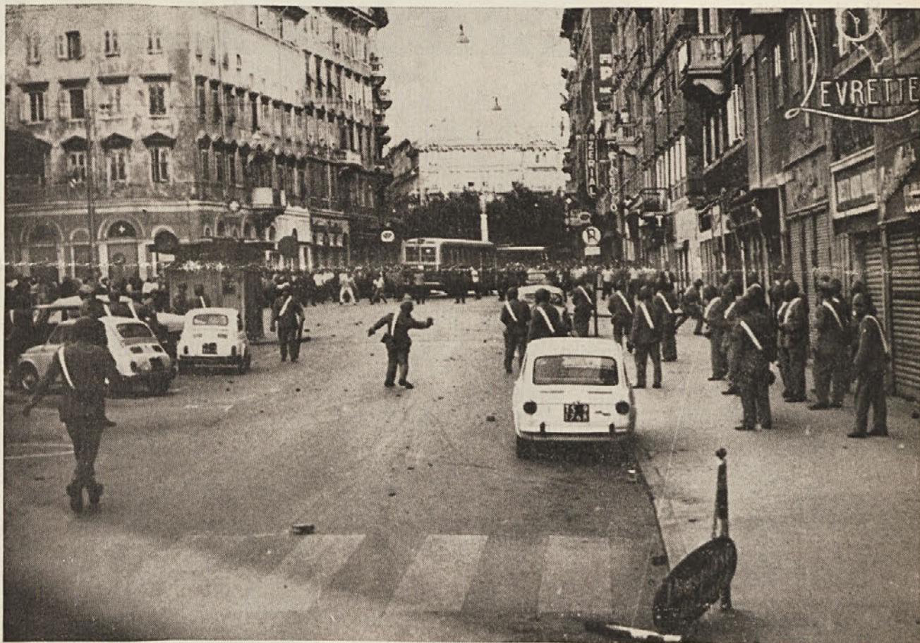
Na Trgu Barriera v Trstu prejšnji petek popoldne. Posebna skupina orožnikov razganja demonstrante. Avtobusi so služili kot učinkovita barikada proti policijskemu navalu

Tržaški komunisti potrjujejo veljavnost bistvenih točk svojega programa ter ponovno poudarjajo svojo pripravljenost, da sodelujejo z delavci in vsem prebivalstvom v borbi za rešitev Trsta.