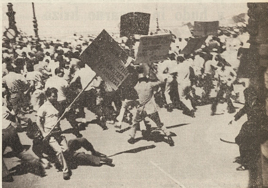
Na Velikem trgu se je povorka ustavila. Toda iz vladne palače so pridrveli policisti in začeli napadati demonstrante. Položaj je postal zelo napet. Prišlo je do pretepov. En delavec je teže ranjen ob'ežal sredi trga