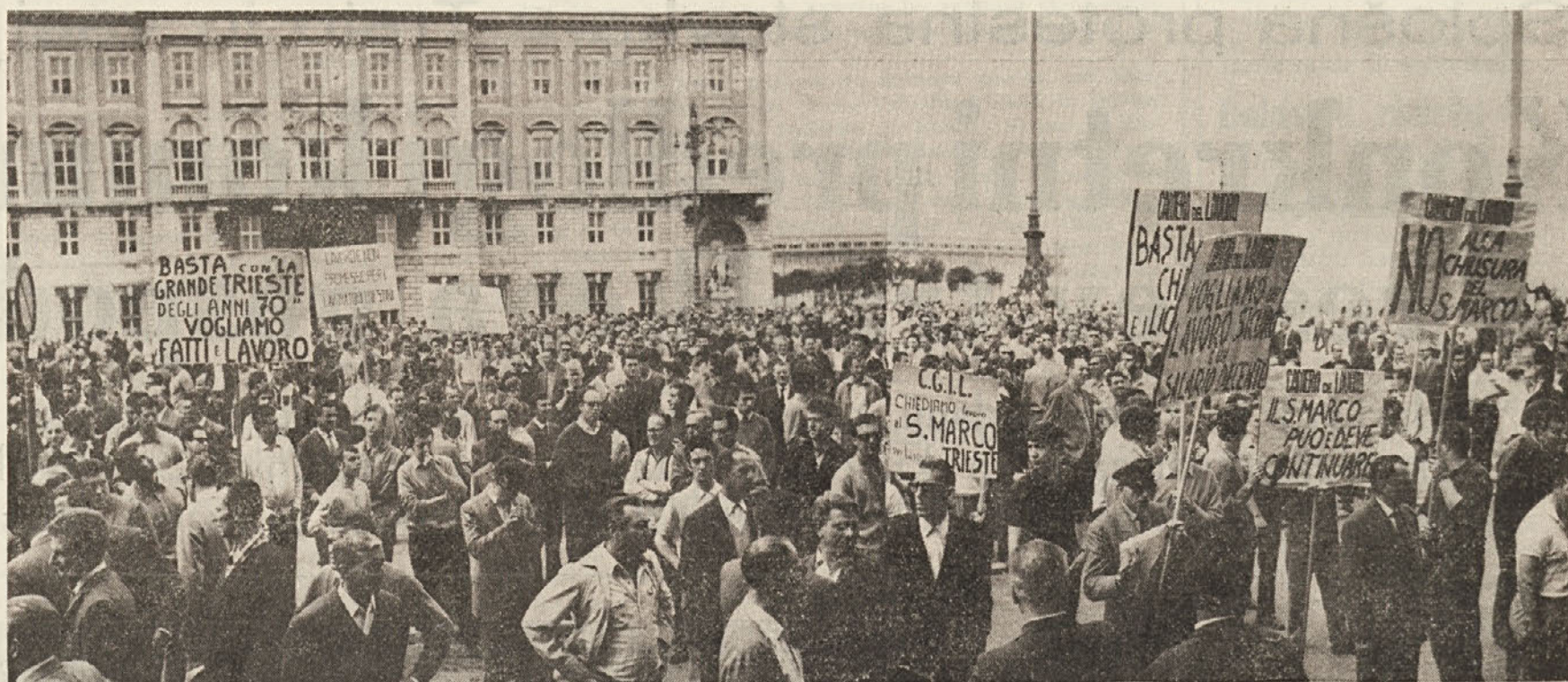
Demonstracija proti zgrešeni politiki, proti sklepm CIPE, ki povzročajo pogubonosne posledice.

Pretekli petek so svetovalci KPI zapustili sejo tržaškega občinskega sveta, ker je župan v