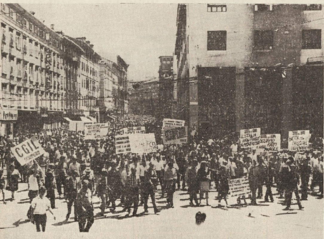
Mogočna delavska povorka na Korzu. Množica je vzklikala: «San Marco», «San Marco», «Hočemo delo!», «Dovolj je obljub!», «Hoče no ladjedelnice, ne obljub!». V zadnjih štirih letih se je število zaposlenih v Trstu znižalo za 10.320 enot