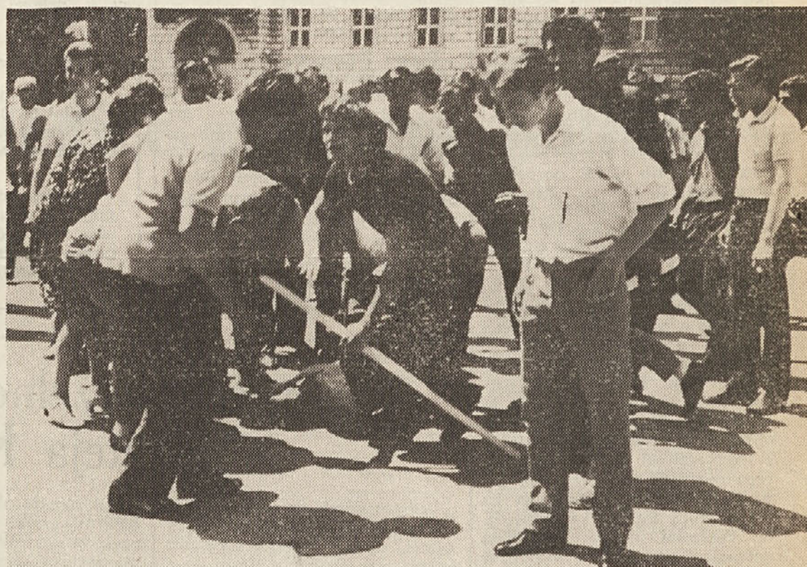
Policisti so demonstrante na Velikem trgu razpršili s pomočjo solzilnih bomb. Ranjenega delavca so odpeljali v bolnišnico. Prvo pomoč so mu nudili tovariši že na kraju, kjer je obležal