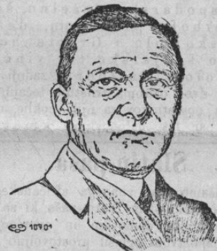
Geh. Rat. Friedr. Graf v. Toggenburg, Statthalter in Tirol

Od italijanske vojne je Tirolska prav hudo