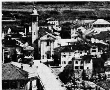
Kanal ob Soči