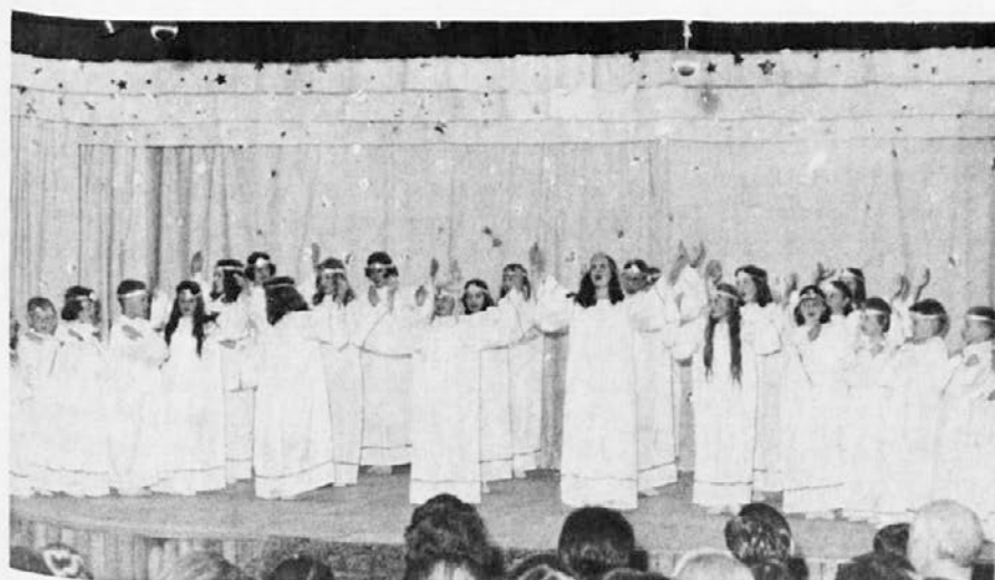
Prostorni oder naše dvorane so napolnili otroci melbournske Slomškove šole, njih prijetni glasovi pa vso dvorano . . . Opereta "Miklavž prihaja", v decembru 1969.