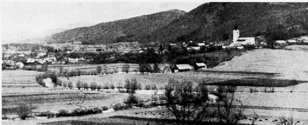
Pokrajina ob izviro reke Krke na Dolenjskem