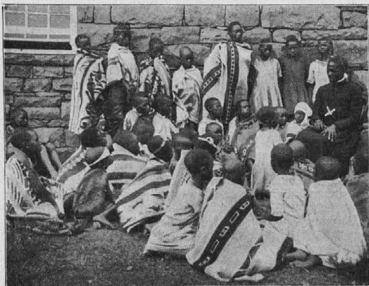
Zamorski duhovnik domačin gre od vasi do vasi in pripravlja zamorčke na sveti krst.

prosta zakuska; saj celo psalmi, dasi tako resni, naposled preidejo v vesel konec. Zato se ne čudite, da smo tudi mi, potem ko je bilo otrokom preskrbljeno za dušne potrebe, tudi njih telo okrepčali. In ali ni naš Gospod tudi tako napravil z množico, ki mu je bila sledila v puščavo?