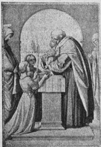
Sveti starček Simeon sprejme božje Dete v naročje.