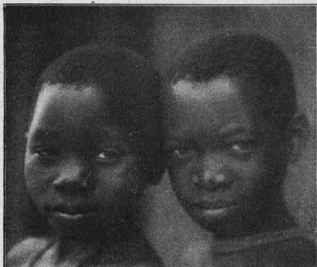
Zamorčka iz Vzhodne Afrike.

Proti koncu 1928. leta sem bil prestavljen v Bailundo. Ta misijon se je tačas lepo razvijal. Kristjanov je bilo kakih 36 tisoč. To je bilo res lepo polje za delovanje, in takega sem želel. Lotil sem se takoj zunanjih šol in to v vedno širšem obsegu. Šole so kar rastle iz tal; od blizu