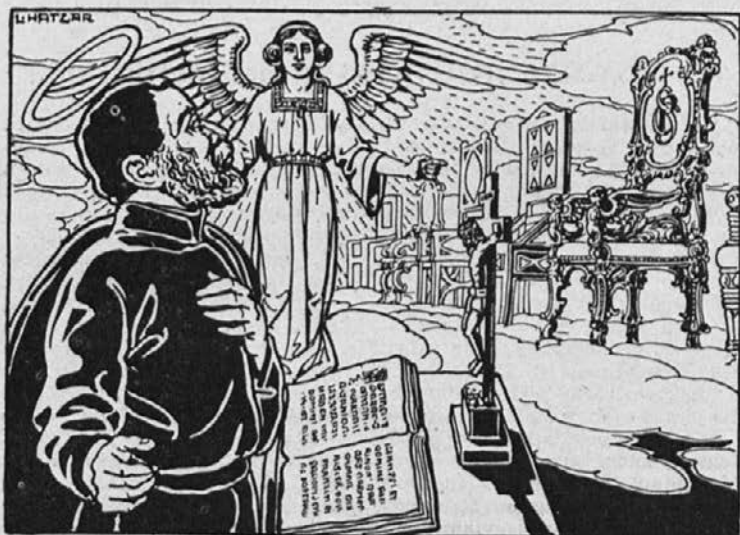
Sv. Alfonz Rodriguez gleda v zamaknjenju prestol sv. Petra Klaverja.

Peter Klaver še ni bil posvečen v duhovnika. Za dobo noviciata je moral prekiniti bogoslovske študije, katere je potem spet nadaljeval. V ta namen ga pošljejo predstojniki v jezuitski kolegij v Malorko. Tu se kmalu seznanj s svetim laiškim bratom Alfonzom Rodriguezom, ki je opravljal