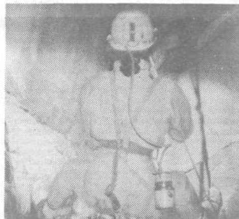
Jamarka v breznu

poleg ostalih kapniških tvorb tudi precej heliktitov, zelo zanimivih kapnikov.