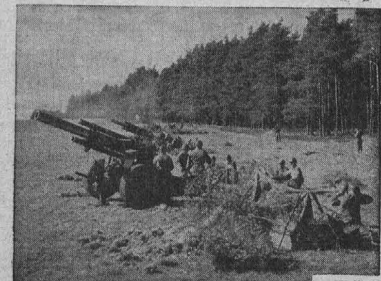
These U. S. Army recruits find that field problems can be fun as well as interesting work. They learn the techniques of weapon firing and the importance of coordination and cooperation with others. The Army today offers many opportunities for education, advancement, and an excellent career.

tlom. A na deset korakov že vruga ne razločiš več, v aprilski noči pa je tako prepolno šumotanja, toliko sumljivih glasov prihaja iz temote in vsak izmed njih budi nemir: "Ali ne gre morebiti, ali se ne plazi rdečearmejska izvidnica?" Nekako od daleč prinaša hrestenje polomljenega puščavnikova, pridržano sopnenje . . . Mladi kovaček Viprjažkin si z rokavico obriše solzice, ki mu je pritekla od napetosti, in s komolecem drege soseda. Ta dremlje, povit v svitek, za vzglavje ima podloženo usnjeno bisago; japonski nabojnik mu tare rebra, a prelen je, da bi se udobneje prelegel, ne mara spustiti v tesno podvite pole plašča curek nočnega hladu. Praskanje pustotnika in dihanje naraščata in nepričakovano se vse oglasi čisto ob Viprjažniku. Ta se pridvigne na laket, zabodeno sredi skozi vejnat pustotnik in trudoma razloči obris velikga ježa. Jež se urno pomika dalje po mišji sledi, majceni svinjski rilček mu je ves v tleh, z iglastim hrbotom škrablja po suhih pustotnikovih bilkah in volhja. Bliskoma začuti nekaj korakov od sebe navzočnost nečesa sovražnega dvigne glavico in zapazi ogledujočega ga človeka. Človek olajšano izdihne sapo in zašepeta: