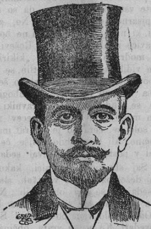
Adalbert Freih. v. Widmann, n. u. österr. Ackerbau-Minister

V tretjo Bienerthovo vlado vstopila sta tudi dva nova moža, katerih sliki prinašamo danes. Prvi je Adalbert