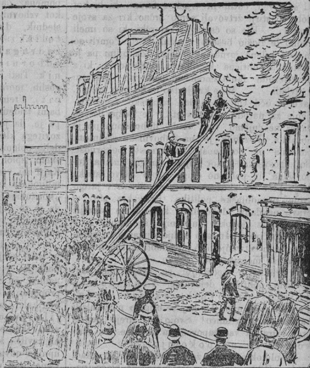
Nach der Beschussung der Anarchisten-Burg in Houndsditch (London)

Poročali smo že o boju, ki ga je imela policija v Londonu z ruskimi anarhisti. Kakor znano, so ti anarhisti ustrelili več policajev. Potem so se skrili v neki hiši, iz katere so ure dolgo na policijo in vojake streljali. Končno so tudi hišo zažgali in našli v plamenih svojo smrt. Naša slika kaže gorečo hišo po boju v trenutku, ko nastopa požarna bramba, da zaduši plamena.