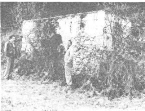
Bo grajska senčnica še naprej prepuščena stihiji časa?

Tako so zdaj misli polhograjskih turističnih zanesenjakov že nekaj časa pri stari grajski senčnici ob vzhodni Polhograjske gore. Objekt prav tako sodi v grajski kompleks in tudi tega je že krepko nagrizel zob časa. Od nekdanje lične zgradbe z obokanim, poslkanim stropom v notranjosti in ograjenim bistrim studenčkam, ki curlja proti grajskemu parku, je ostala le mračna kamnita po-