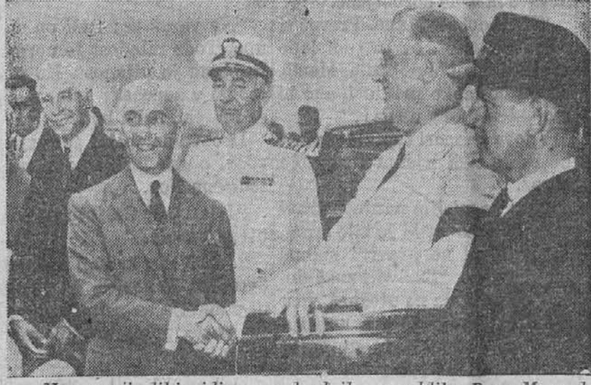
Na gornji sliki vidimo predsednika republike Peru Manuela Prado-a, in predsednika Roosevelta, ko se pozdravljata ob prihodu Prada v Washinton.