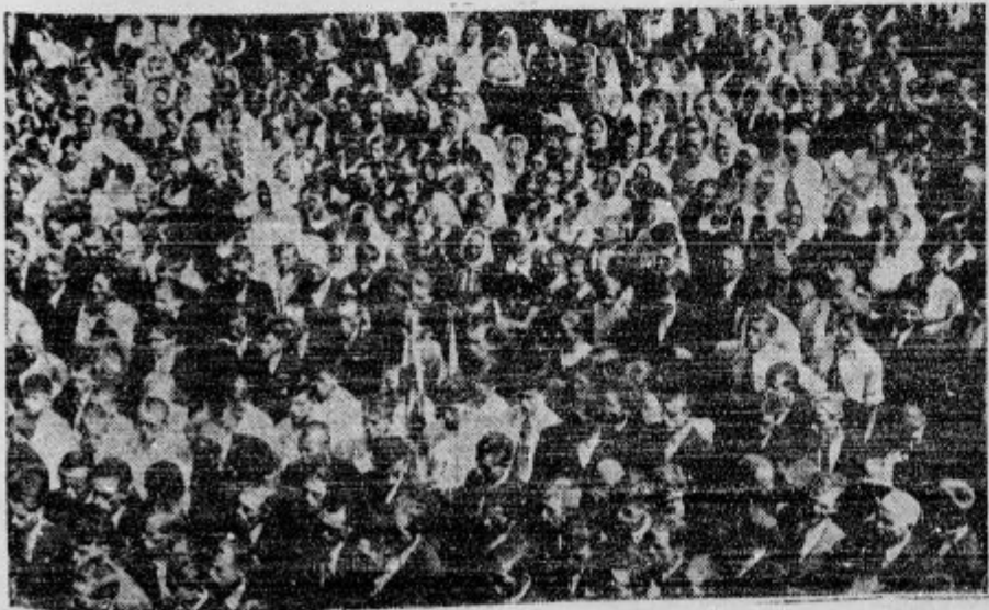
Del množic na prosvetnem taboru v Žužemberku

(Nadaljevanje na prihodnji strani spodaj)