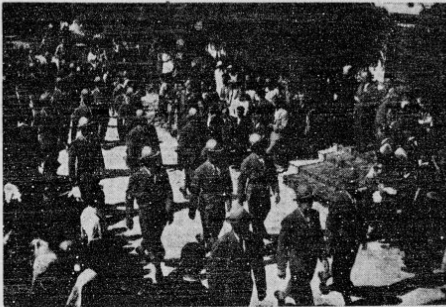
Člani fantovskih odsekov v sprevodu ob priliki prosvetnega tabora v Mengšu. Na odru na desni strani minister dr. Krek in ban dr. M. Natlačen

žici majhne organizirane celice odločnih, zvestih in organiziranih katoličanov — vsak v svojem okolju in poklicu. To je pravi duhovniški poklic. Zlasti mladina je poklicana na to delo. Vera nam nič ne velja, če ni dejanj, poleg močne vere v božično in velikonočno skrivnost tudi vere v Duha, po katerem bomo usposobljeni za goreča dejanja evangelijske ljubezni med slovenskimi brati.