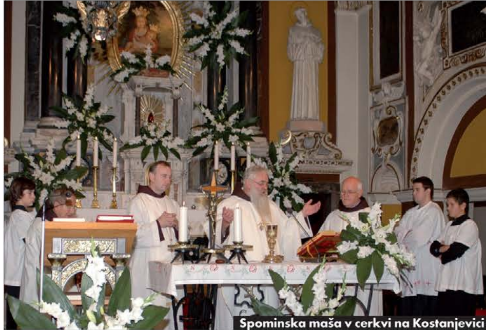
Spominška maša v cerkvi na Kostanjevici

prevzela Fakulteta za humanistiko Univerze v Novi Gorici ali Raziskovalna postaja znanstvenoraziskovalnega centra Slovenske akademije znanosti in umetnosti v Novi Gorici ali oba skupaj, ki bi tematiko prihodnjih simpozijev lahko oz. morala tudi razširili. O Škrabcu pa bi bilo potrebno spregovoriti še kot o pisatelju na-